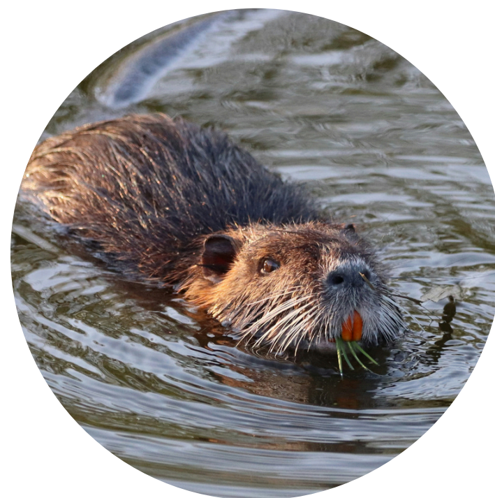
911 NUTRIE (372 nel 2023)