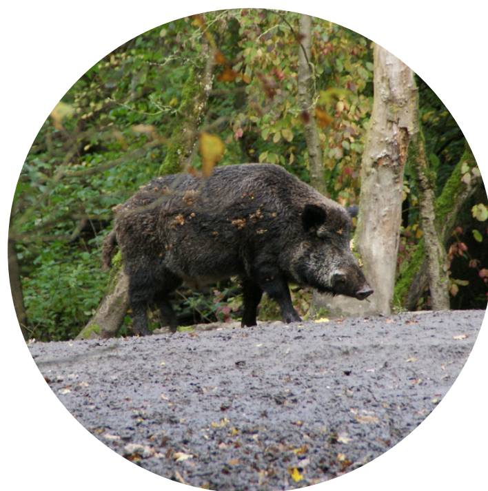
1805 CINGHIALI (1319 nel 2023)