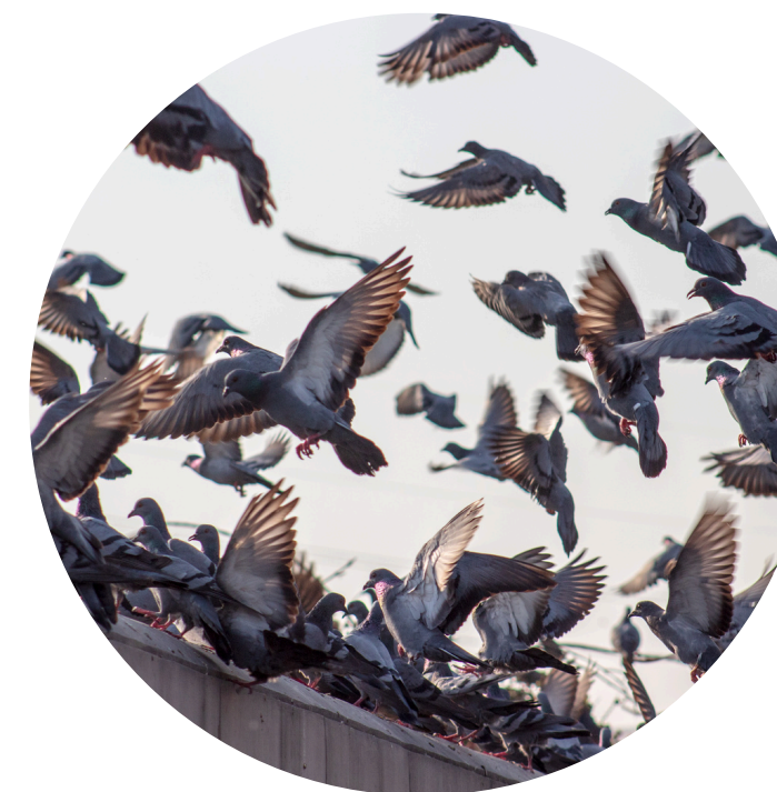
12128 COLOMBI (11541 nel 2023)