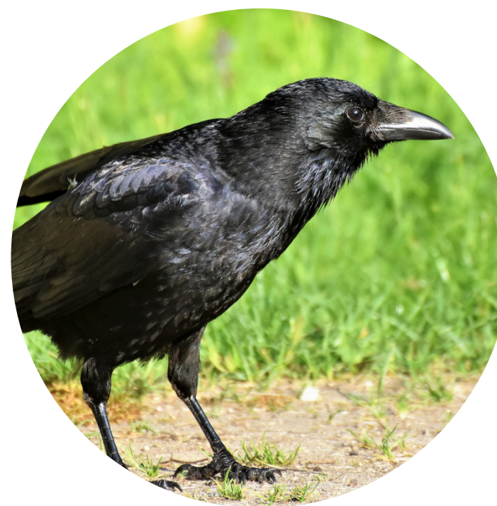
2039 CORVIDI (1393 nel 2023)