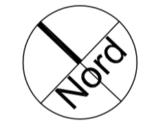
PLANIMETRIA GENERALE Scala 1:500