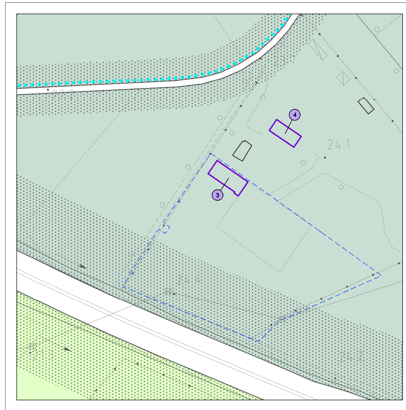
ESTRATTO PIANO DEGLI INTERVENTI