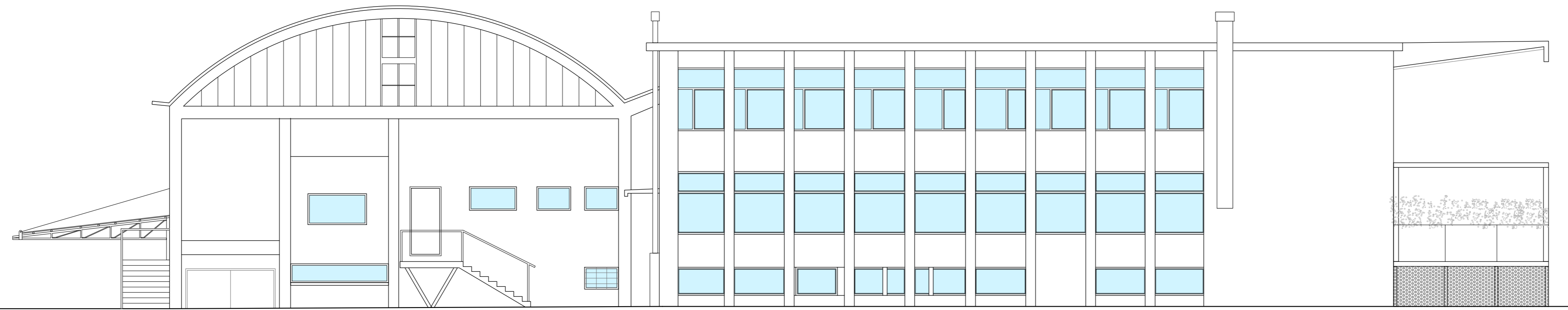
PROSPETTO SUD - Scala 1:100