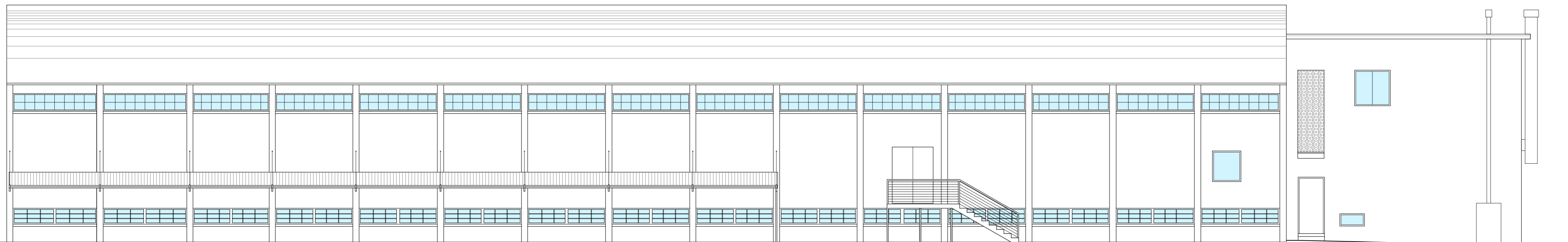
PROSPETTO OVEST - Scala 1:100