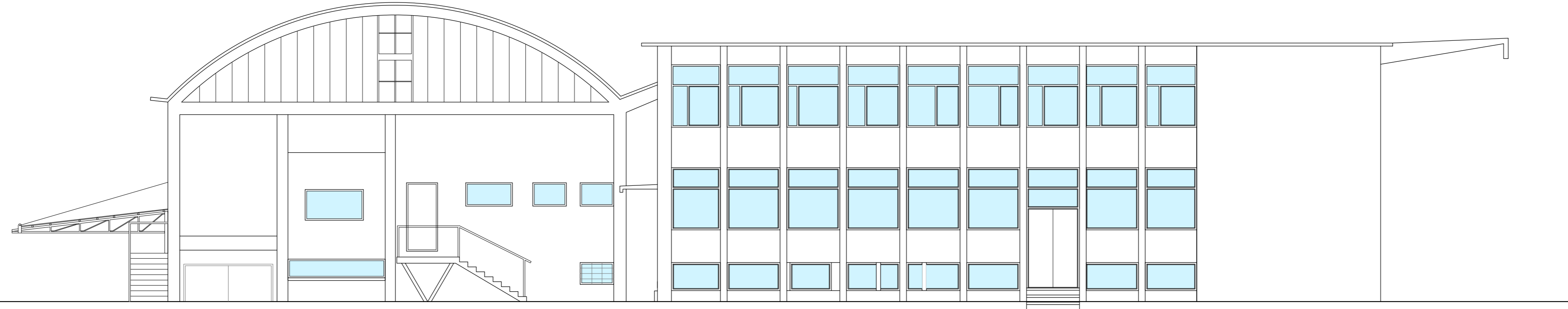
PROSPETTO NORD - Scala 1:100