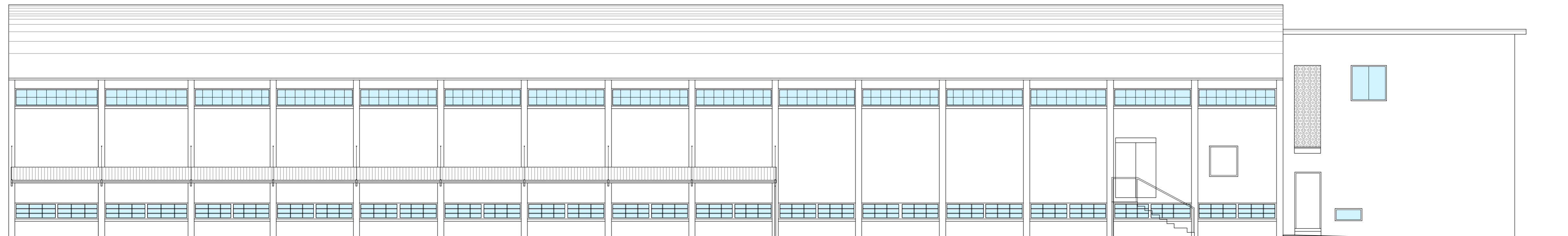
PROSPETTO OVEST - Scala 1:100