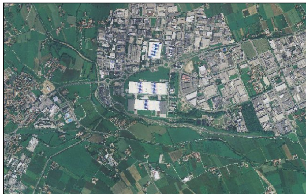
6 - PCN – Anno 2006