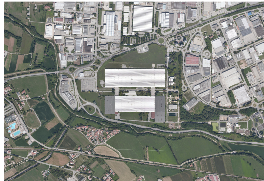
8 - SIT COMUNE DI SCHIO – Anno 2018