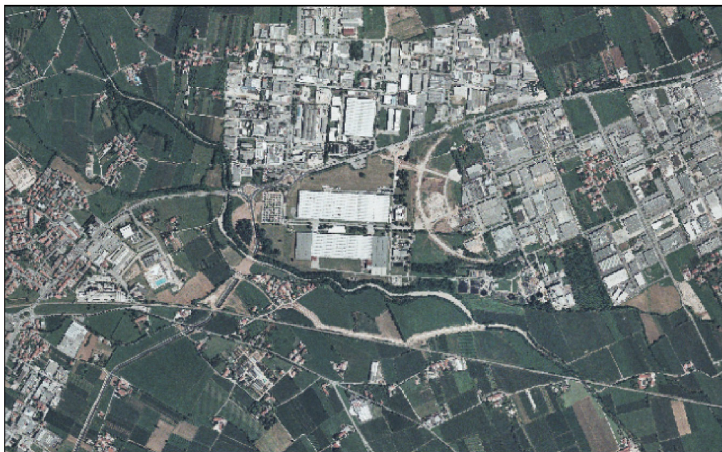
5 - PCN – Anno 2000