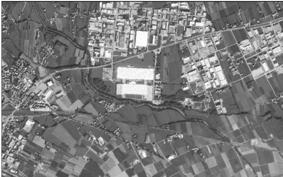
3 - PCN - Anno 1988