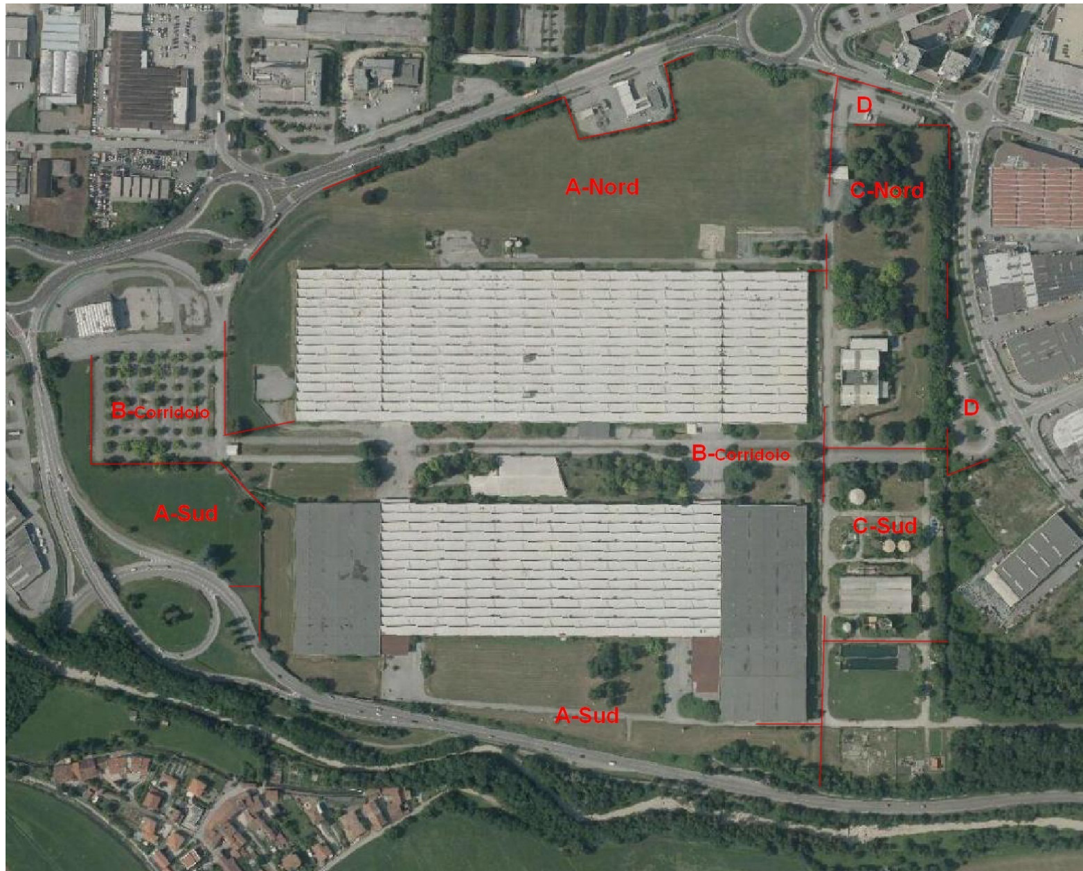
11 - Situazioni culturali esemplificative attuali