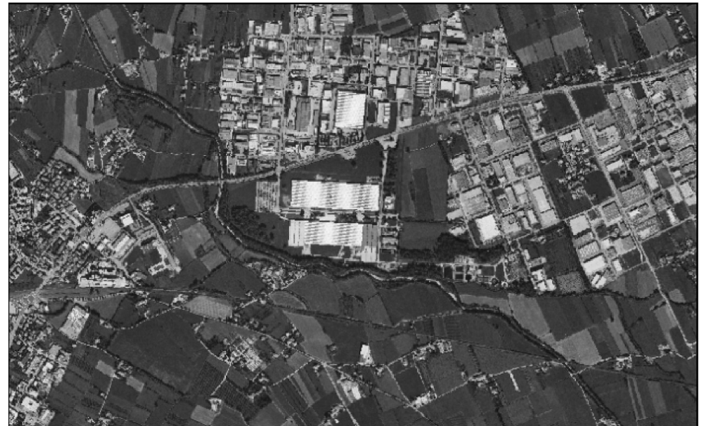
4 - PCN - Anno 1994