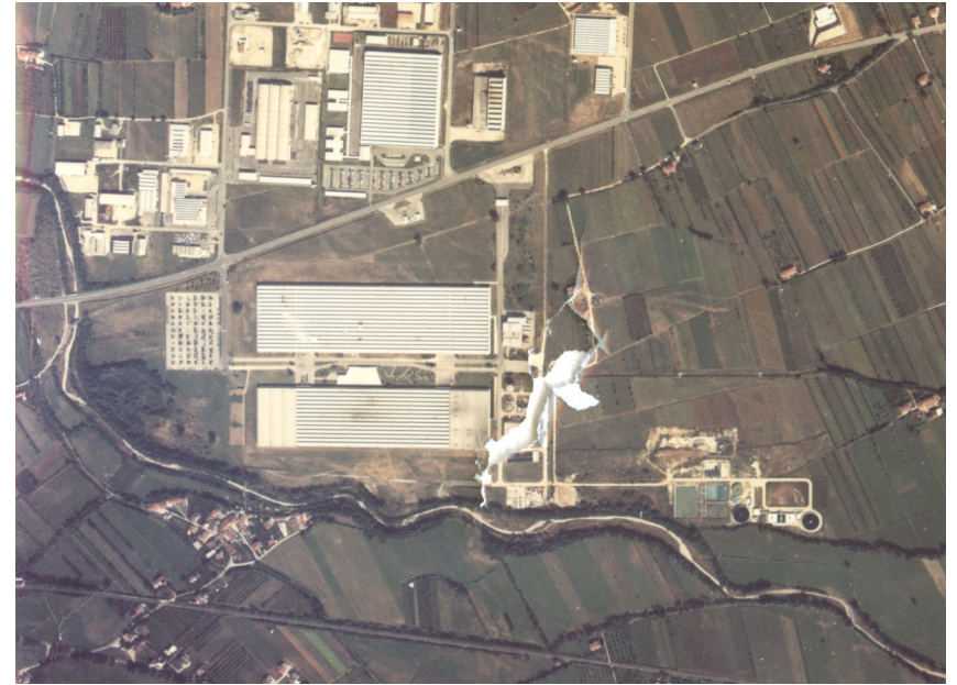
2 - Ortofoto - Anno 1976