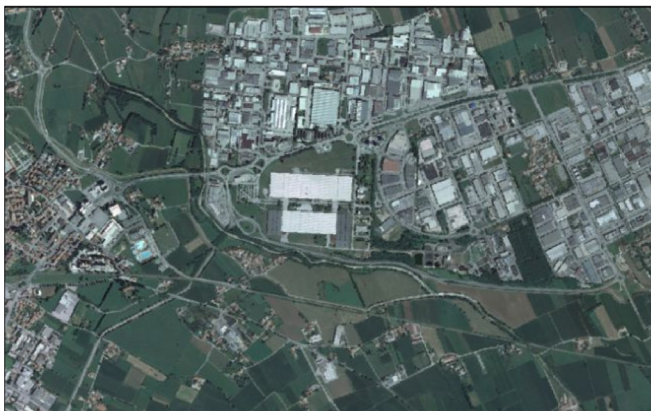
7 - PCN – Anno 2012