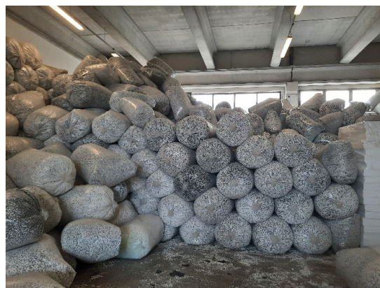
Stoccaggio delle MPS (6)