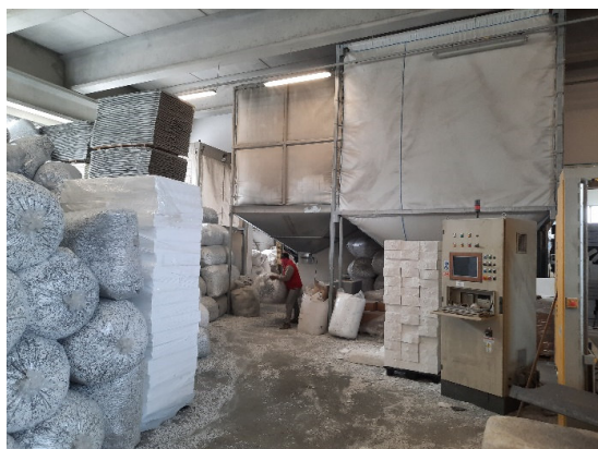
Insilaggio e insacchettamento delle MPS (4-5)

Di seguito si riportano alcune riprese fotografiche dello stabilimento sito in Comune di Cassola.