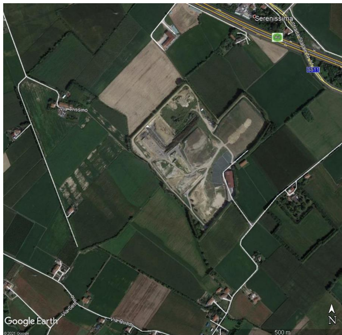
Figura 1 - Aerofotogramma con l'impianto di Discarica – viabilità urbana (retino bianco) ed extraurbana (retino giallo)

Dal Piano di Classificazione Acustica del territorio Comunale di Grumolo delle Abbadesse (VI), come analizzato nel Quadro di riferimento programmatico dell'Elaborato B1, risulta che la discarica si trova in una zona classificata come "aree prevalentemente industriale" (Classe V) , mentre le abitazioni circostanti sono in zona classificata come "aree di tipo misto" (Classe III).