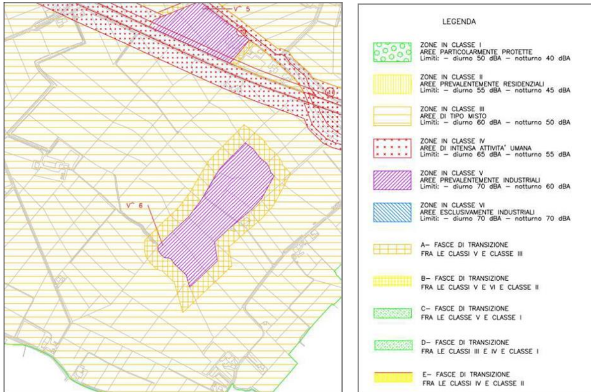
Figura 2 - Estratto della Zonizzazione Acustica del Comune di Grumolo delle Abbadesse (VI)