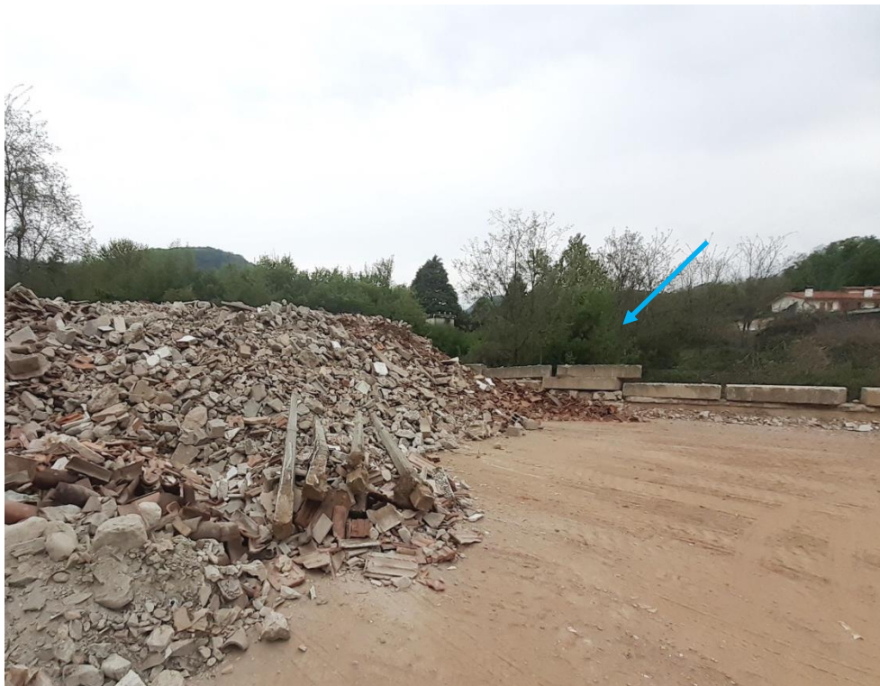
Figura 4: zona della messa in riserva R13 dei rifiuti di demolizione e posizione vasca di raccolta (freccia blu)