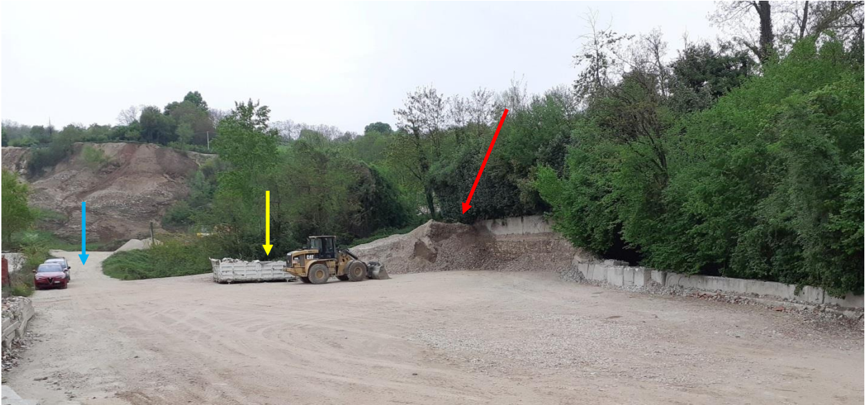
Figura 3: Vista del piazzale pavimentato dell'impianto ROSSI srl, con ingresso sulla sinistra (freccia blu), area rifiuti in cassone (freccia gialla) e area MPS sulla destra (freccia rossa)