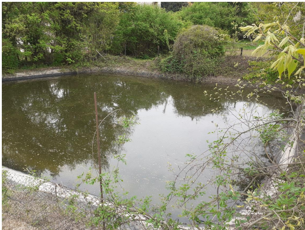
Figura 5: Bacino impermeabilizzato di raccolta e sedimentazione delle acque di dilavamento del piazzale impianto