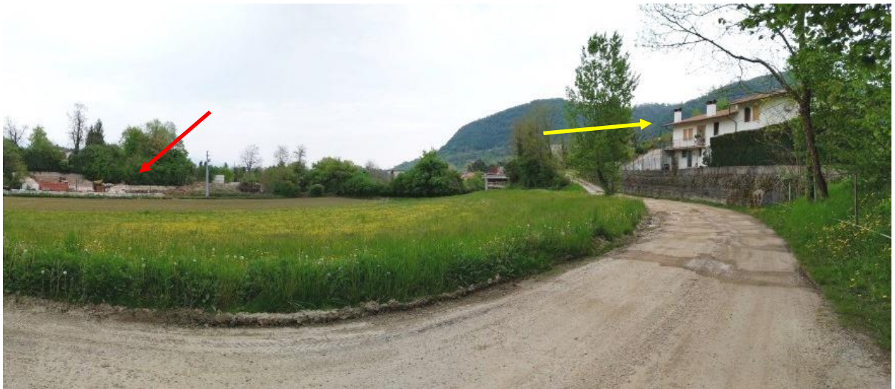
Figura 2: panoramica dell'impianto dalla strada di accesso (freccia rossa), con vista sull'abitazione prospiciente (freccia gialla)