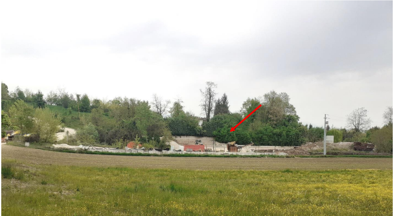
Figura 1: panoramica dell'area dell'impianto ROSSI Srl vista dalla strada di accesso a Cava Val Orcele