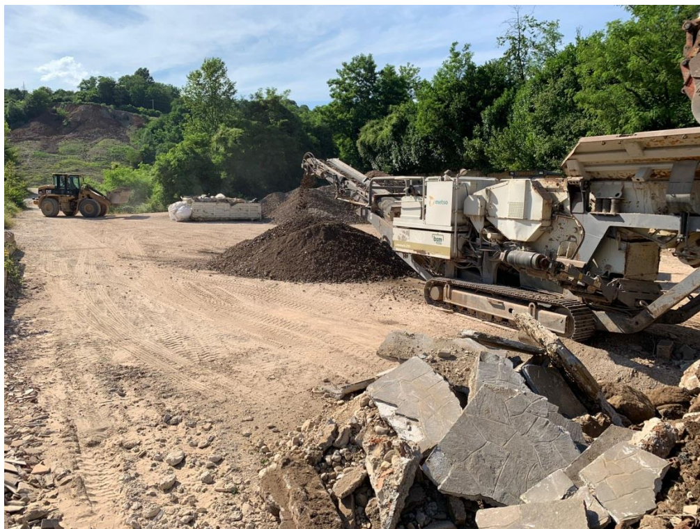
Figura 6: Lavorazione dei rifiuti nell'area centrale, con formazione cumuli di materiale lavorato da caratterizzare