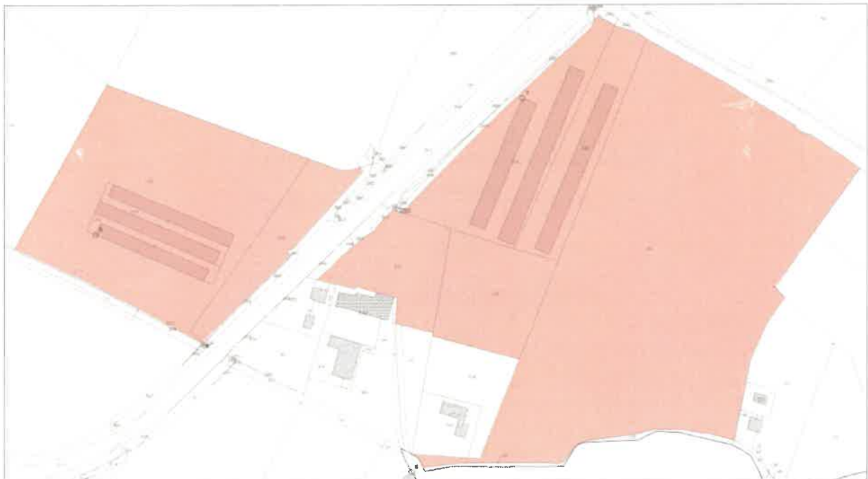
Figura 1 - Estratto catastale particelle foglio 1 Comune di Montegaldella (VI).

I terreni risultano essere in conduzione dell'azienda Furegon Sergio.