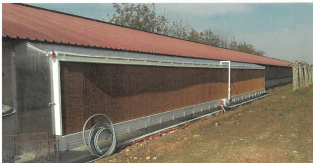
Figura 5: Foto cooling azienda simile

Nei capannoni esistenti è già presente l'impianto di raffrescamento su ambo i lati dei capannoni. Nei due capannoni avicoli che verranno realizzati verrà installato su ambo i lati degli stessi, in prossimità della testata opposta ai ventilatori.