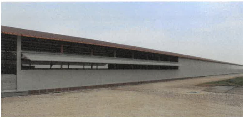
Figura 4: Particolare delle finestre a vasistas, prima del posizionamento del cooling, in un'azienda simile

Il sistema di cooling è composto da pannelli in fogli di cellulosa a conformazione di nido d'ape, che vengono attraversati da acqua spruzzata da una linea posta sopra il pannello. L'aria calda esterna, richiamata all'interno dall'impianto di aria forzata, entrando in contatto con l'acqua ne cede il calore, raffrescandosi. L'acqua in parte evapora per il passaggio di calore e viene consumata nel processo di raffrescamento, in parte viene fatta circolare nuovamente nel pannello grazie al sistema di ricircolo a pompe, limitandone così gli sprechi (foto sotto).