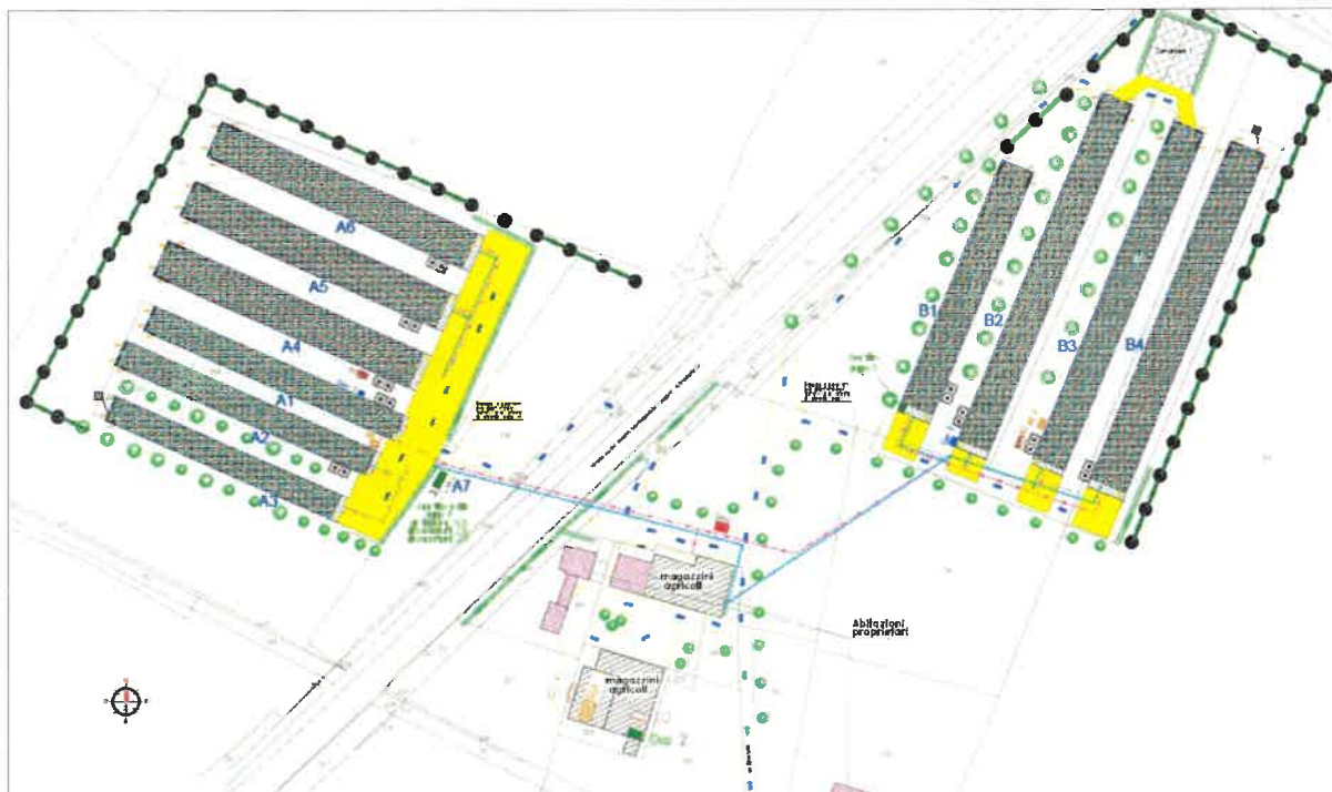
Figura 2 - situazione azienda POST intervento

centro zootecnico, pertanto non sarà necessario il ricalcolo delle distanze urbanistiche previste dalla Legge Regionale 11 del 2004.