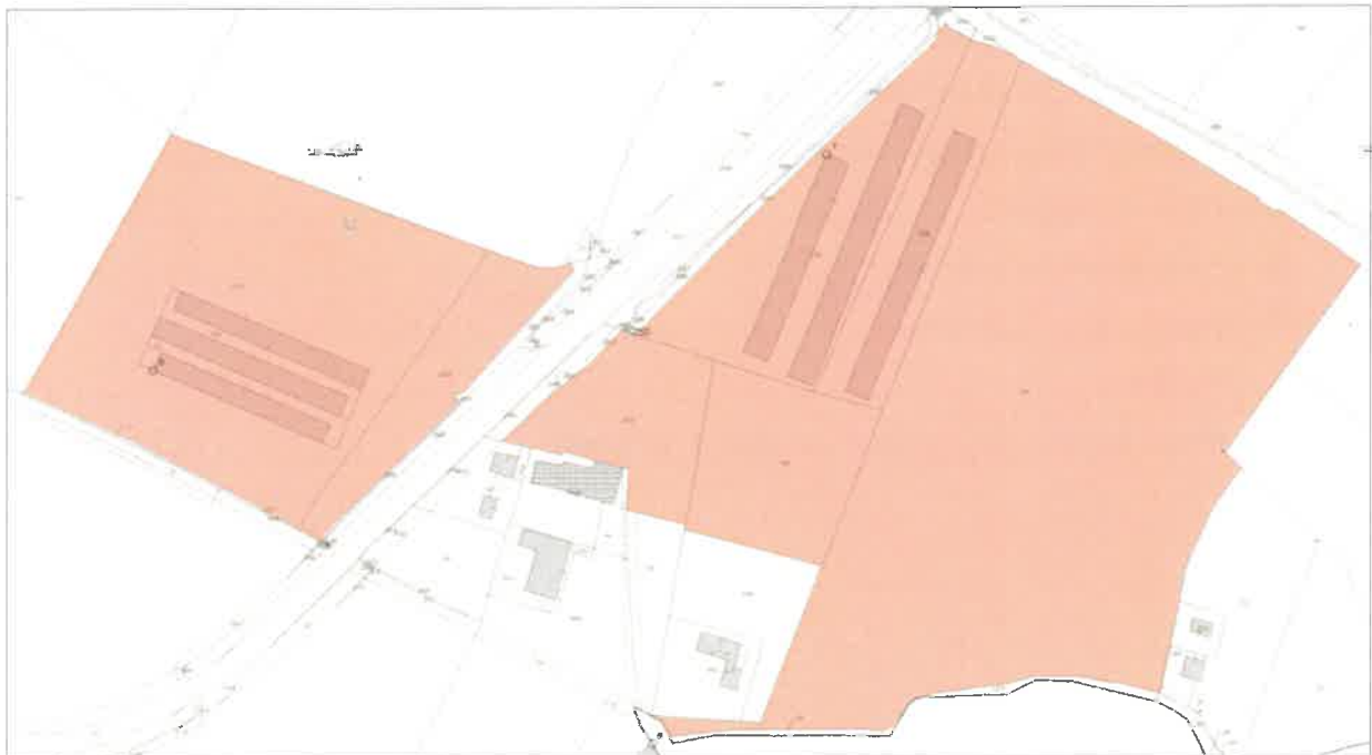
Figura 1 - Estratto catastale particelle foglio 1 Comune di Montegaldella (VI).

I terreni risultano essere in conduzione dell'azienda Furegon Sergio.