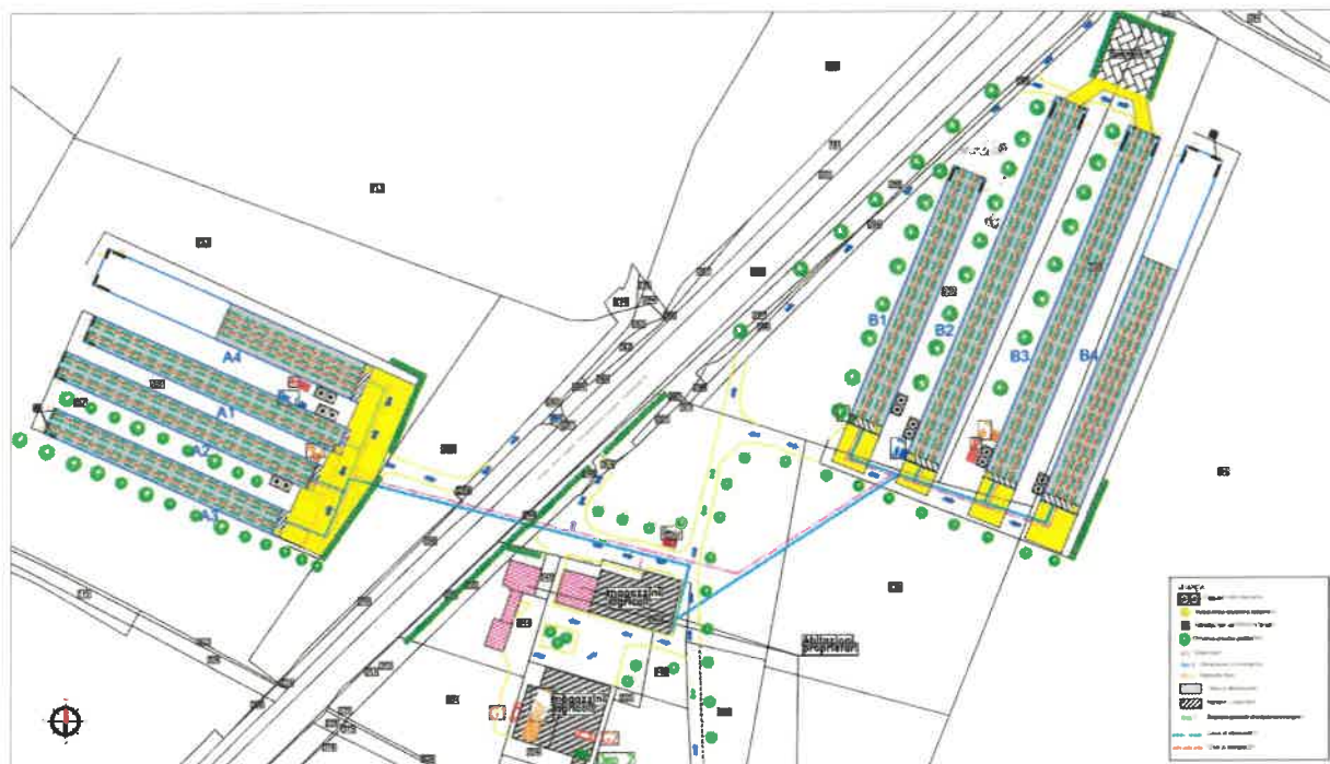
Figura 3 - Disposizione azienda ANTE intervento

I capannoni esistenti presentano al loro interno, oltre all'area di stabulazione per l'allevamento degli animali, una pre-camera "dogana danese" per la biosicurezza dell'allevamento posta su una delle due testate dei capannoni. I capannoni esistenti sono dotati di impianto di ventilazione forzata, con aspiratori presenti sulla testata di fondo dei capannoni. L'aria prelevata passa attraverso le prese d'aria poste nella posizione più lontana rispetto ai ventilatori. Nei capannoni esistenti inoltre è già presente l'impianto di raffrescamento "cooling system" su ambo i lati dei capannoni.