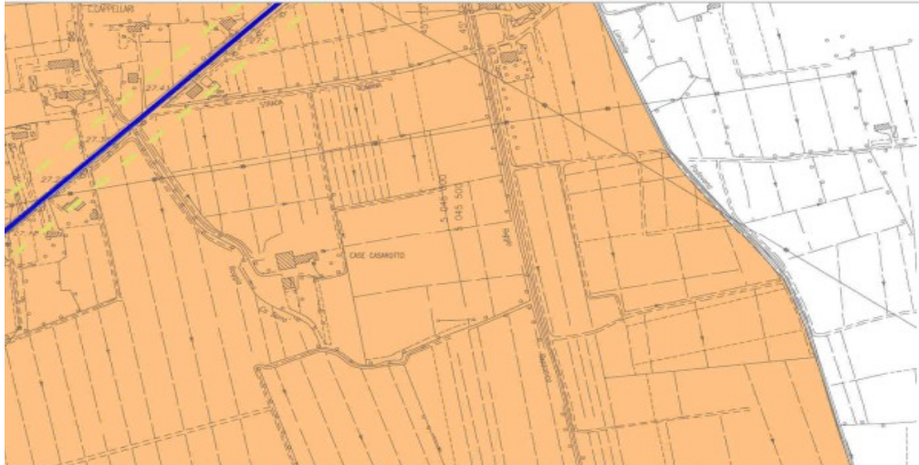
Estratto zonizzazione acustica – Comune di Camisano Vicentino