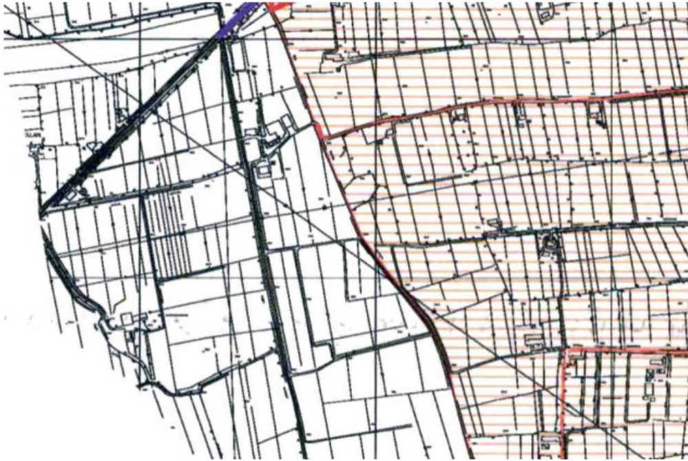
Estratto zonizzazione acustica – Comune di Piazzola sul Brenta