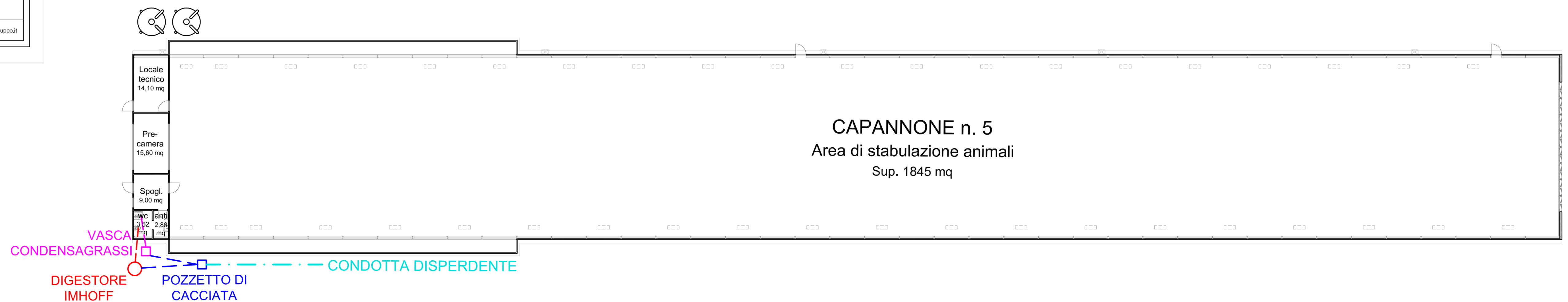
PIANTA PIANO TERRA CAPANNONE 5 - scala 1:200