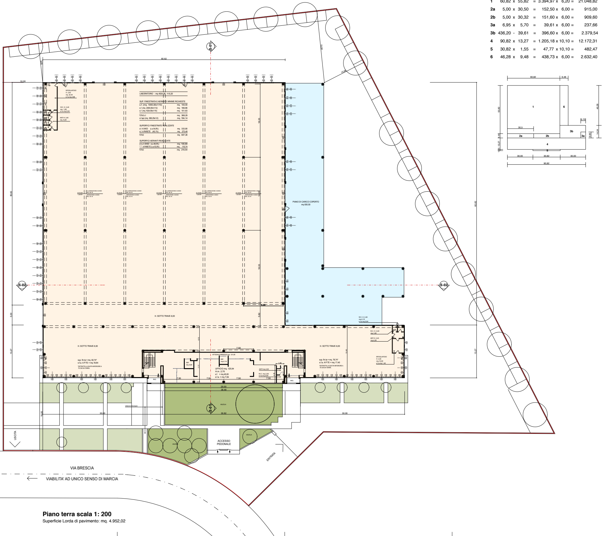
Piano terra scala 1: 200 Superficie Lorda di pavimento: mq. 4.952,02