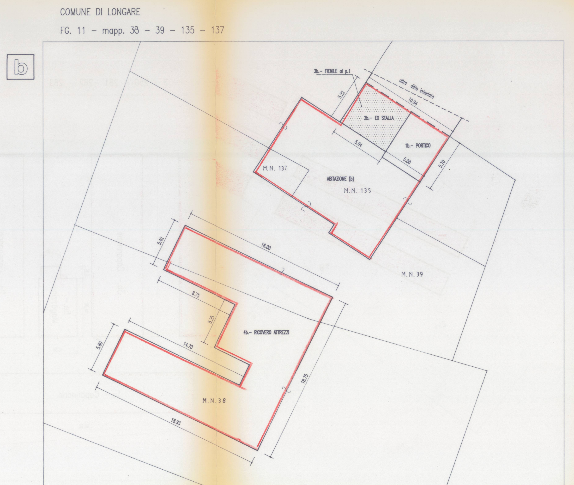
grafico scala 1:200