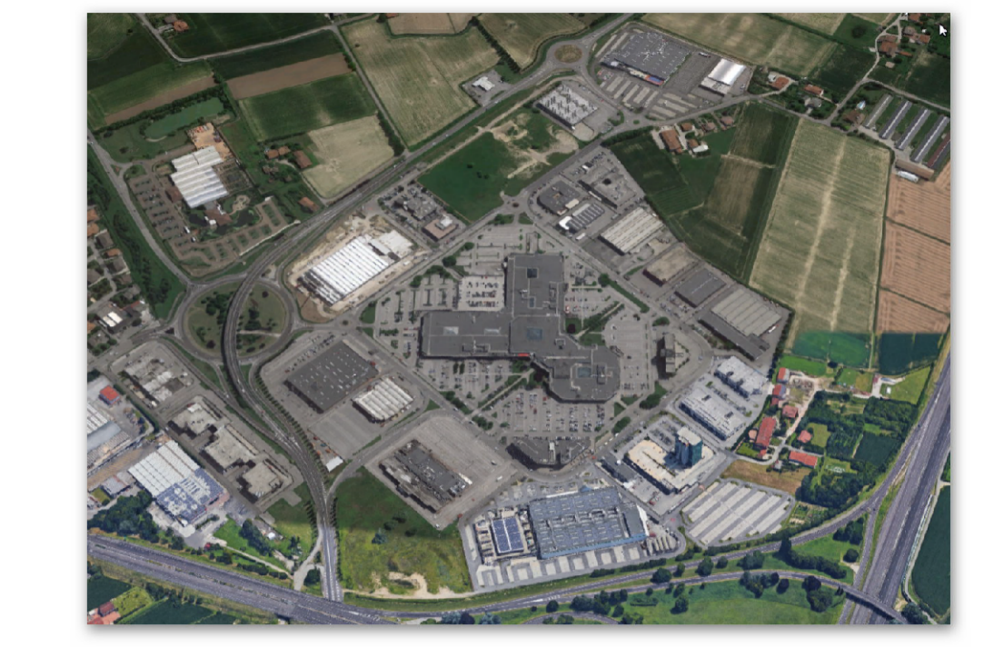
ELABORATI PROGETTUALI EDIFICIO "E"