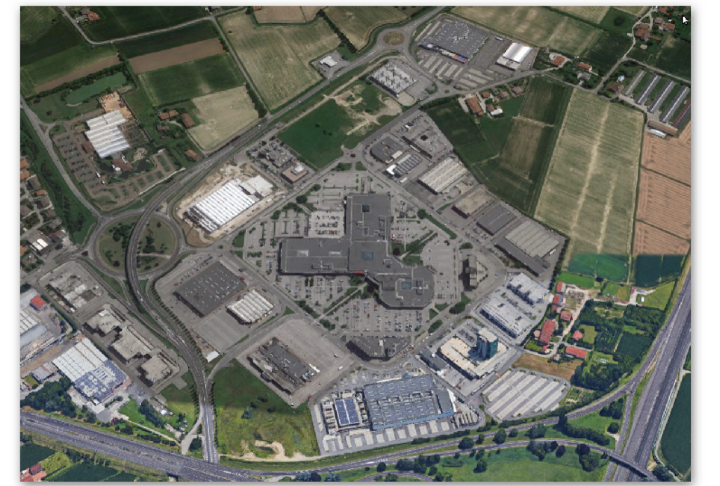
ELABORATI PROGETTUALI EDIFICIO "A"

D.Lgs. 3 Aprile 2006 n. 152 e ss.mm.ii. Legge Regionale del Veneto 18 Febbraio 2016 n. 4