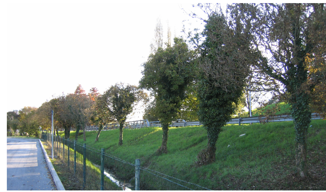
FOTO 5 QUINTA VEGETATIVA DI SEPARAZIONE CON RACCORDO AUTOSTRADALE