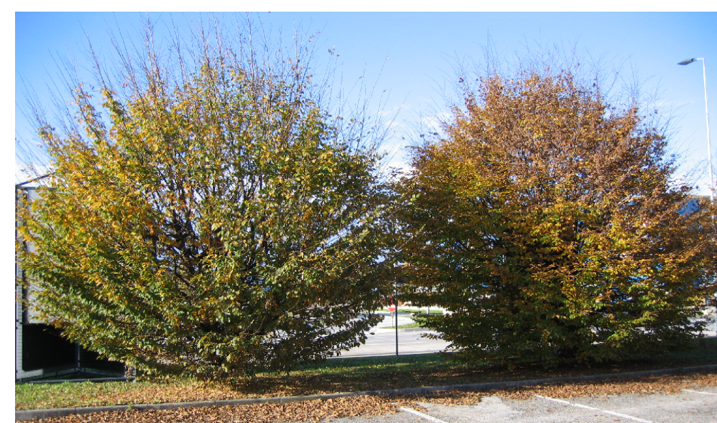
FOTO 4 QUINTA VEGETATIVA SU AIUOLE DI SEPARAZIONE TRA PARCHEGGI E VIABILITA' DI PIANO