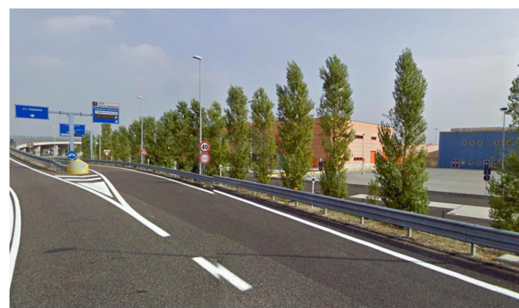
FOTO 1 QUINTA VEGETATIVA COSTITUITA DA FILARE DI ALBERI