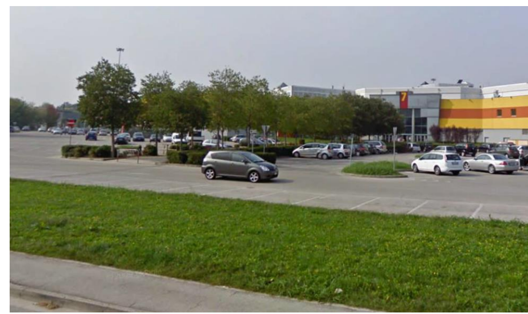
FOTO 3 FILARI A SCHERMATURA DEGLI INGRESSI E FASCIE VERDI DI SEPARAZIONE TRA VIABILITA' E PARCHEGGI