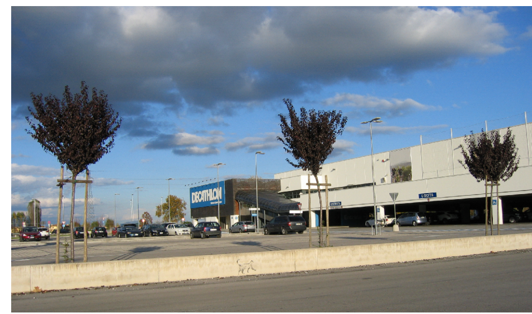
FOTO 6 NUOVE PIANTUMAZIONI SU LOTTO F