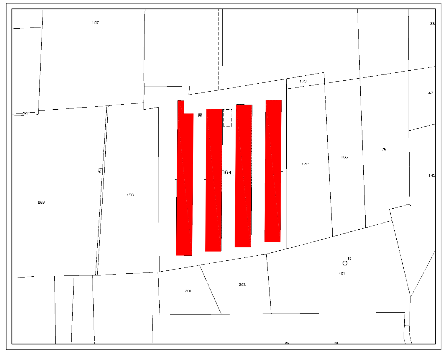
ESTRATTO MAPPA CATASTALE - FOGLIO 12° - MAPPALE 364 scala 1:2000