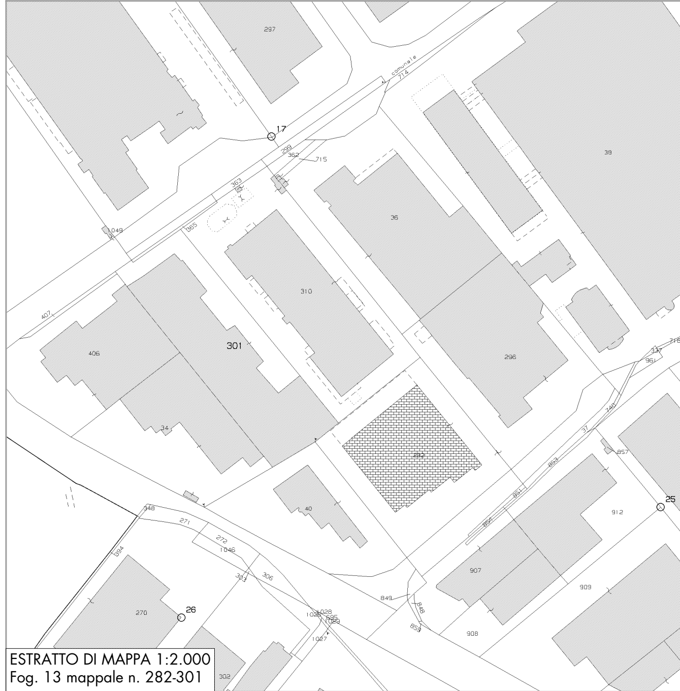
ESTRATTO DI MAPPA 1:2.000 Fog. 13 mappale n. 282-301

LAY-OUT SCARICHI APPROVIGIONAMENTO IDRICO - stato di fatto -