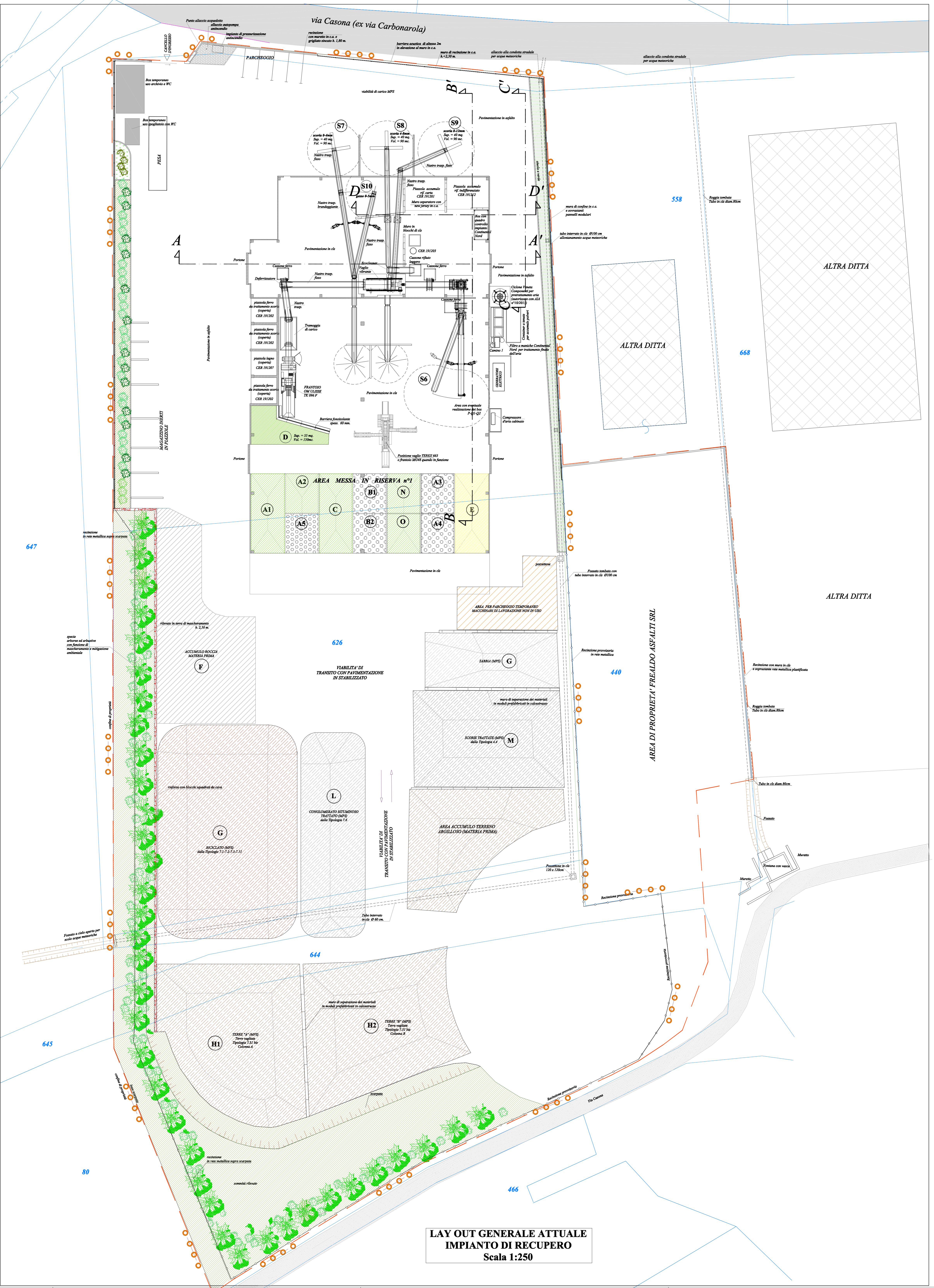
LAY OUT GENERALE ATTUALE IMPIANTO DI RECUPERO Scala 1:250