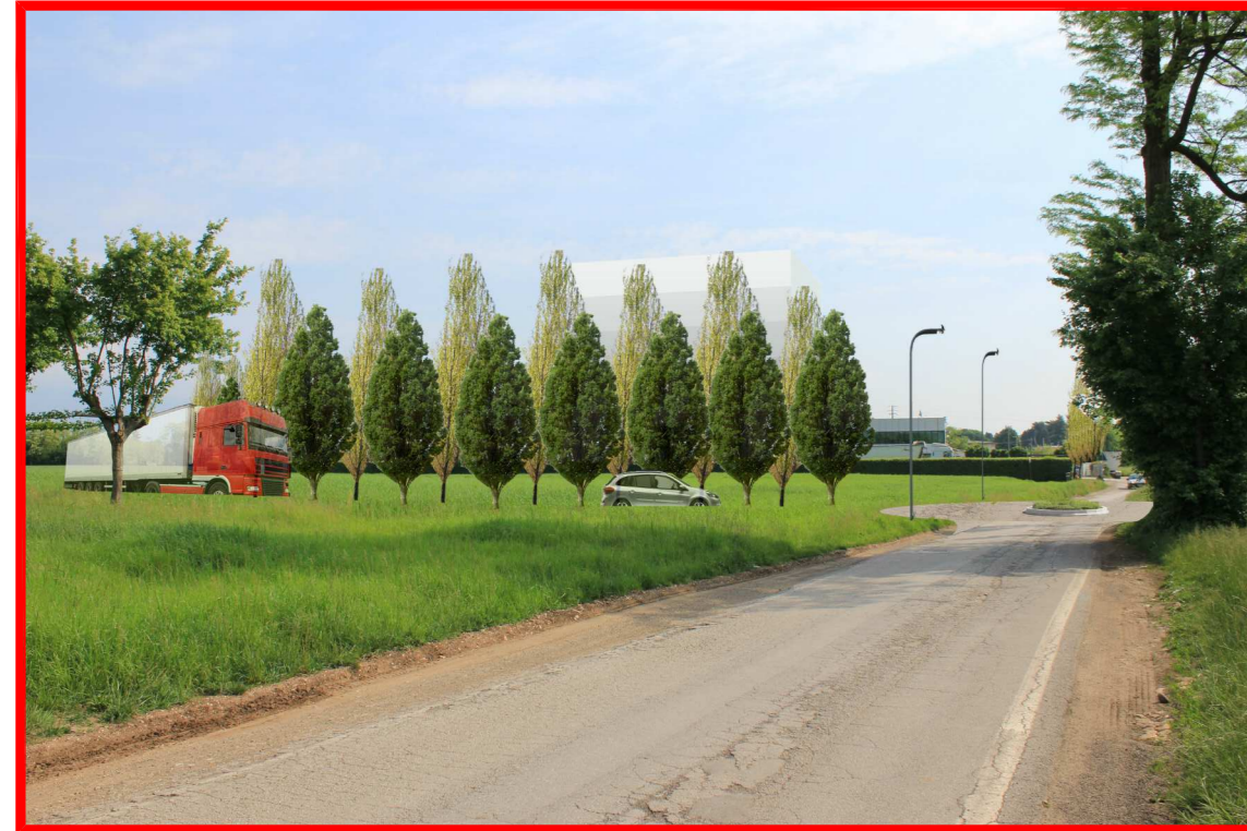
opere di mitigazione