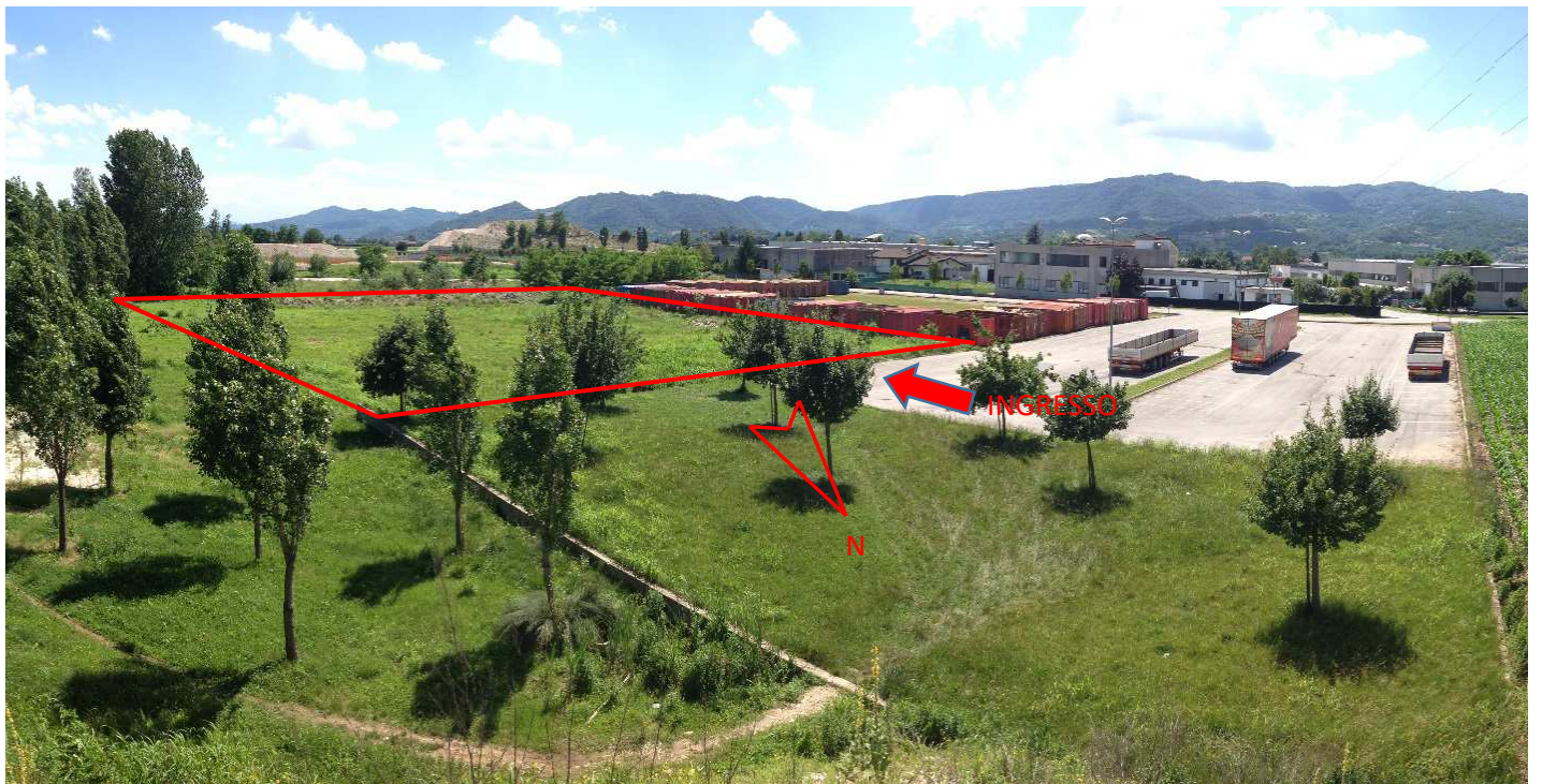
2. Panoramica area impianto