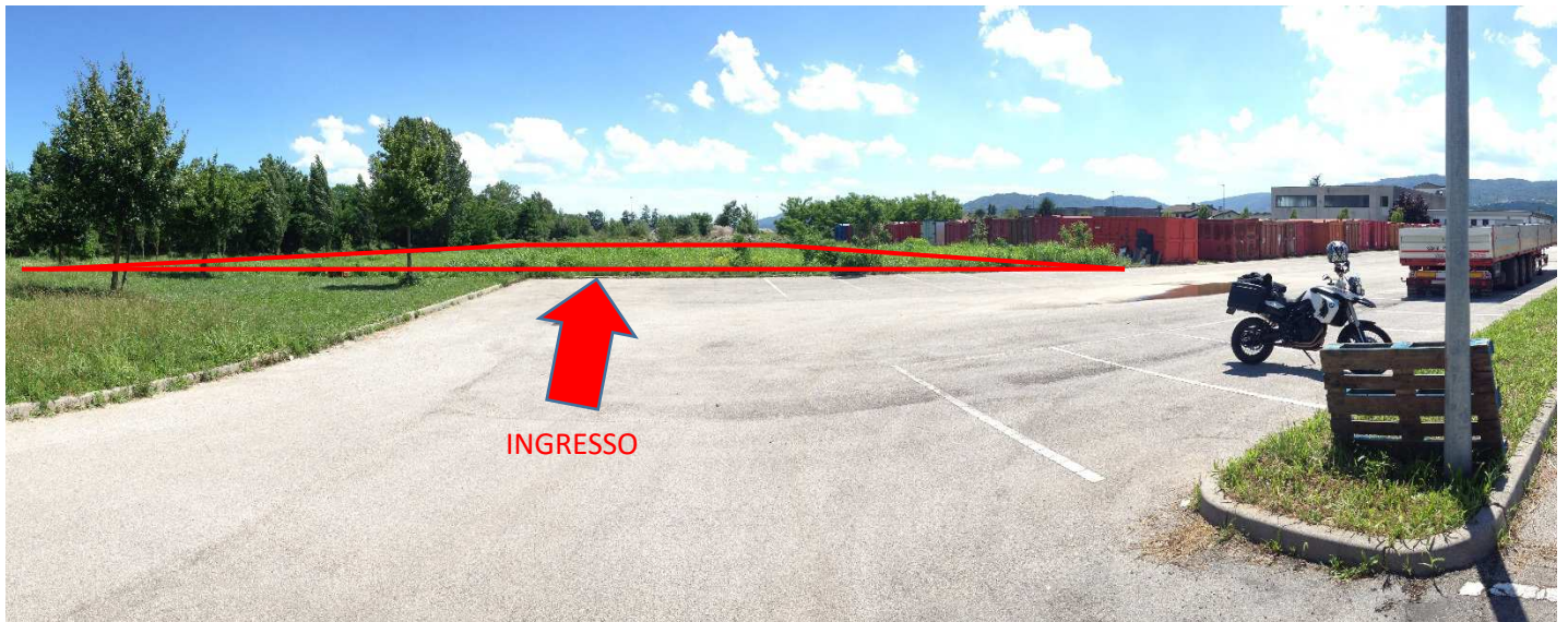
1. Lato Nord – Parcheggio ed ingresso all'impianto