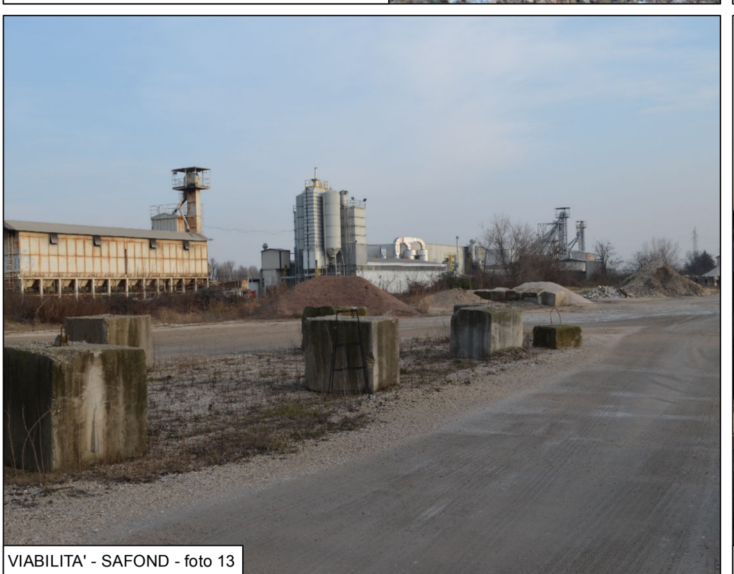
VIABILITA' - SAFOND - foto 13