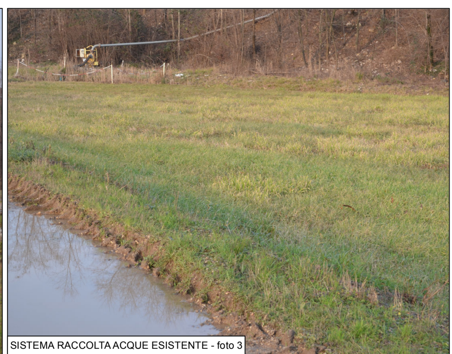
SISTEMA RACCOLTA ACQUE ESISTENTE - foto 3