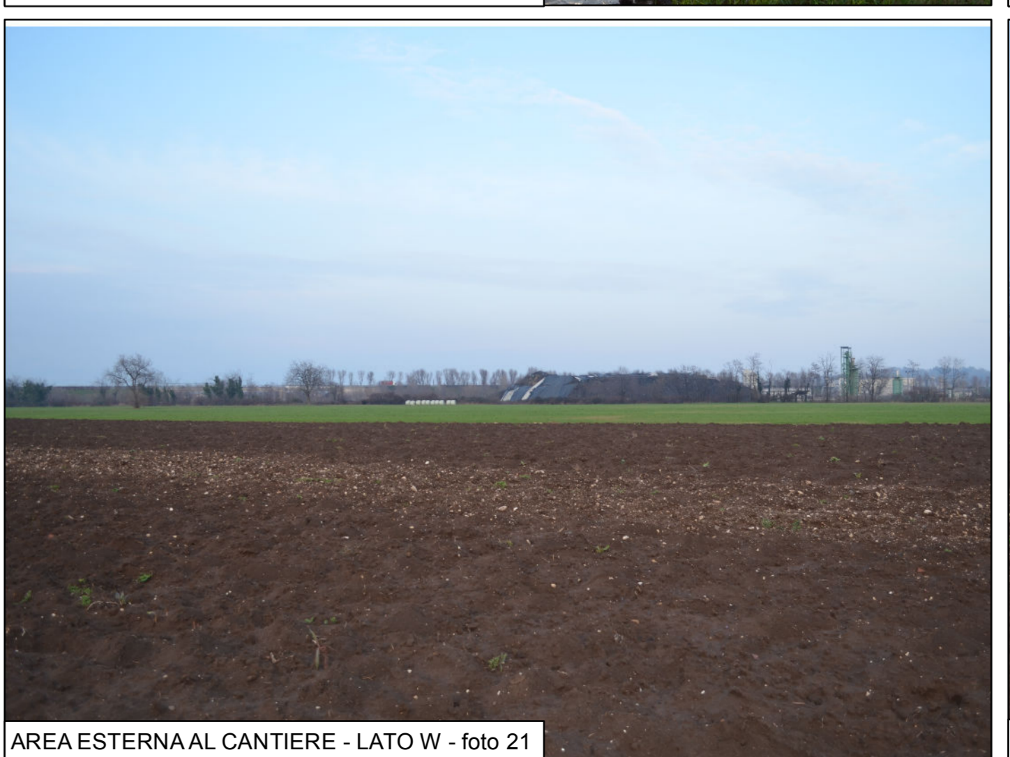
AREA ESTERNA AL CANTIERE - LATO W - foto 21