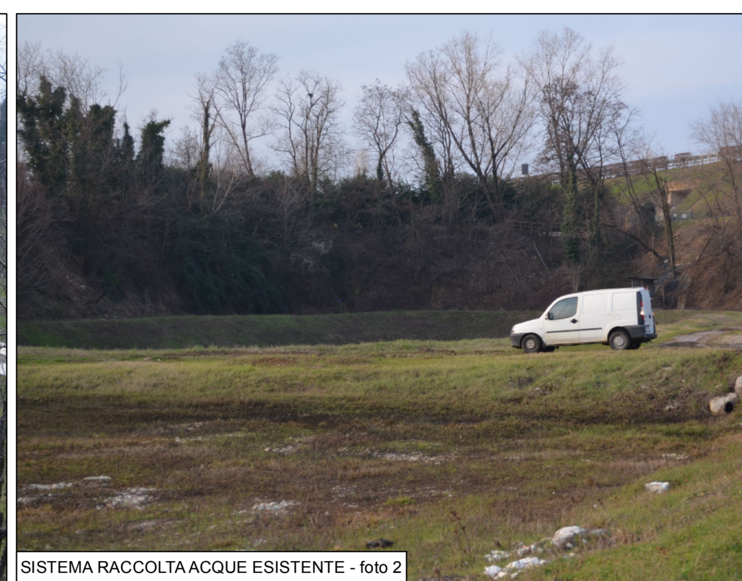
SISTEMA RACCOLTA ACQUE ESISTENTE - foto 2