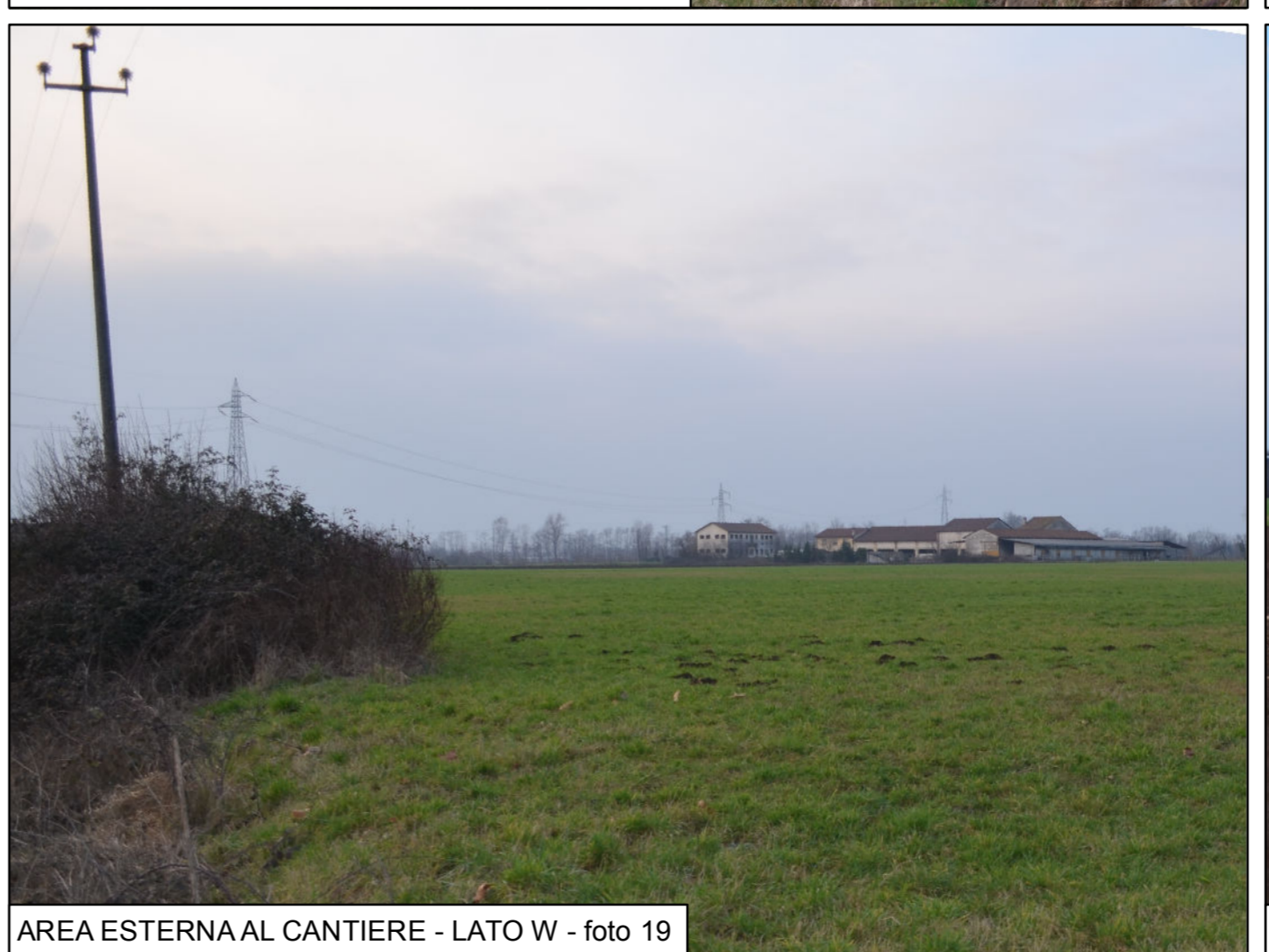
AREA ESTERNA AL CANTIERE - LATO W - foto 19