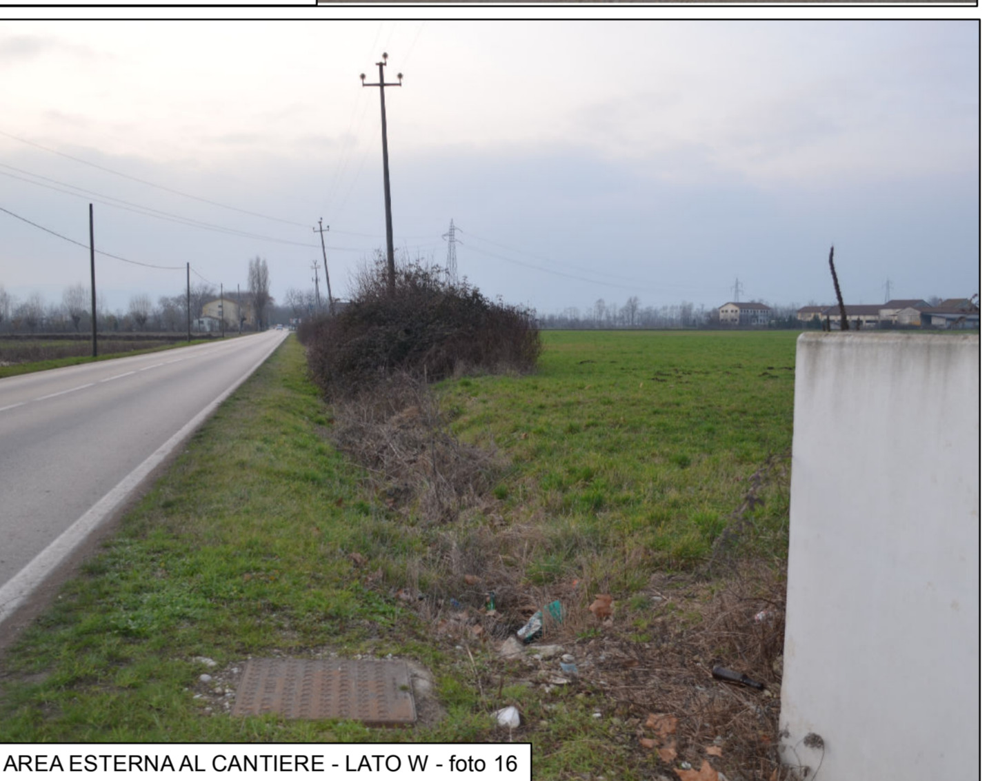
AREA ESTERNA AL CANTIERE - LATO W - foto 16