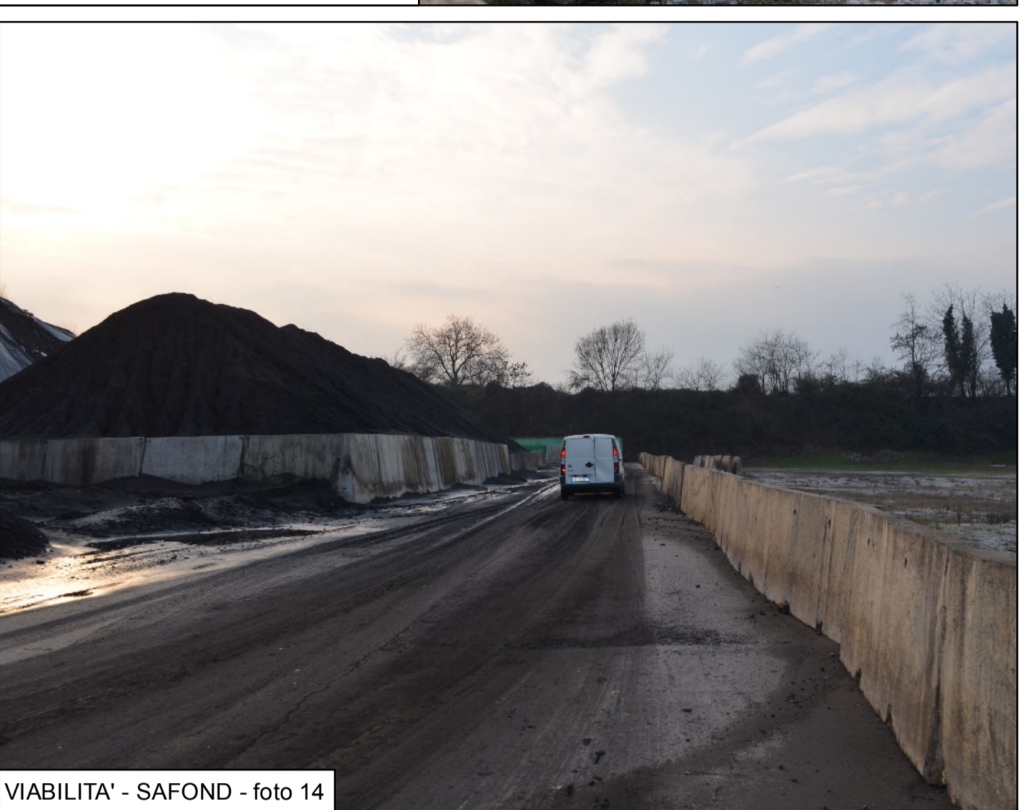
VIABILITA' - SAFOND - foto 14