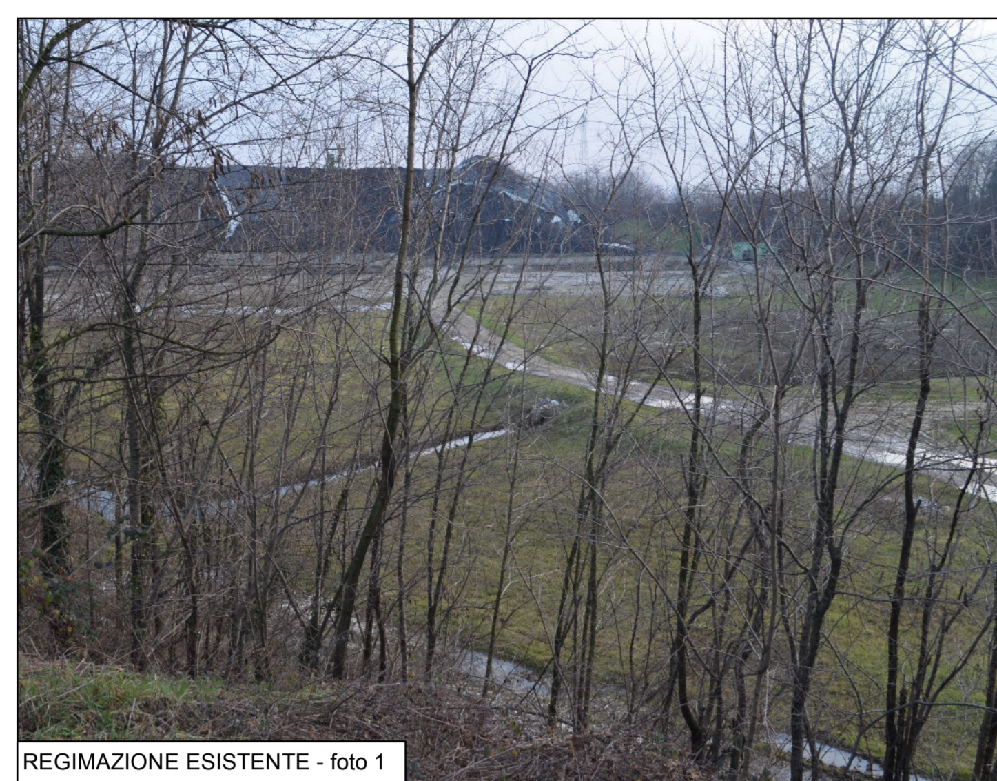
REGIMAZIONE ESISTENTE - foto 1