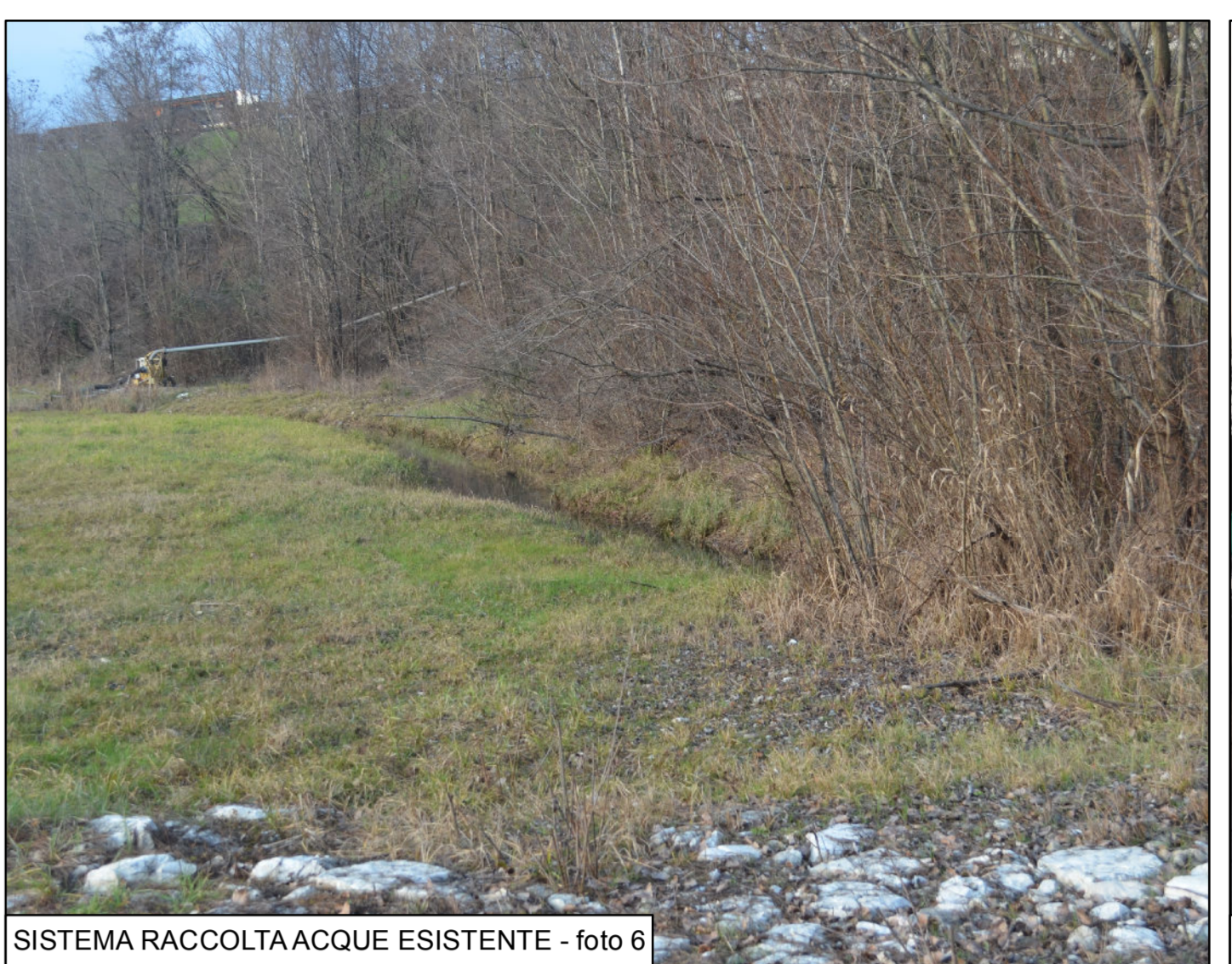
SISTEMA RACCOLTA ACQUE ESISTENTE - foto 6