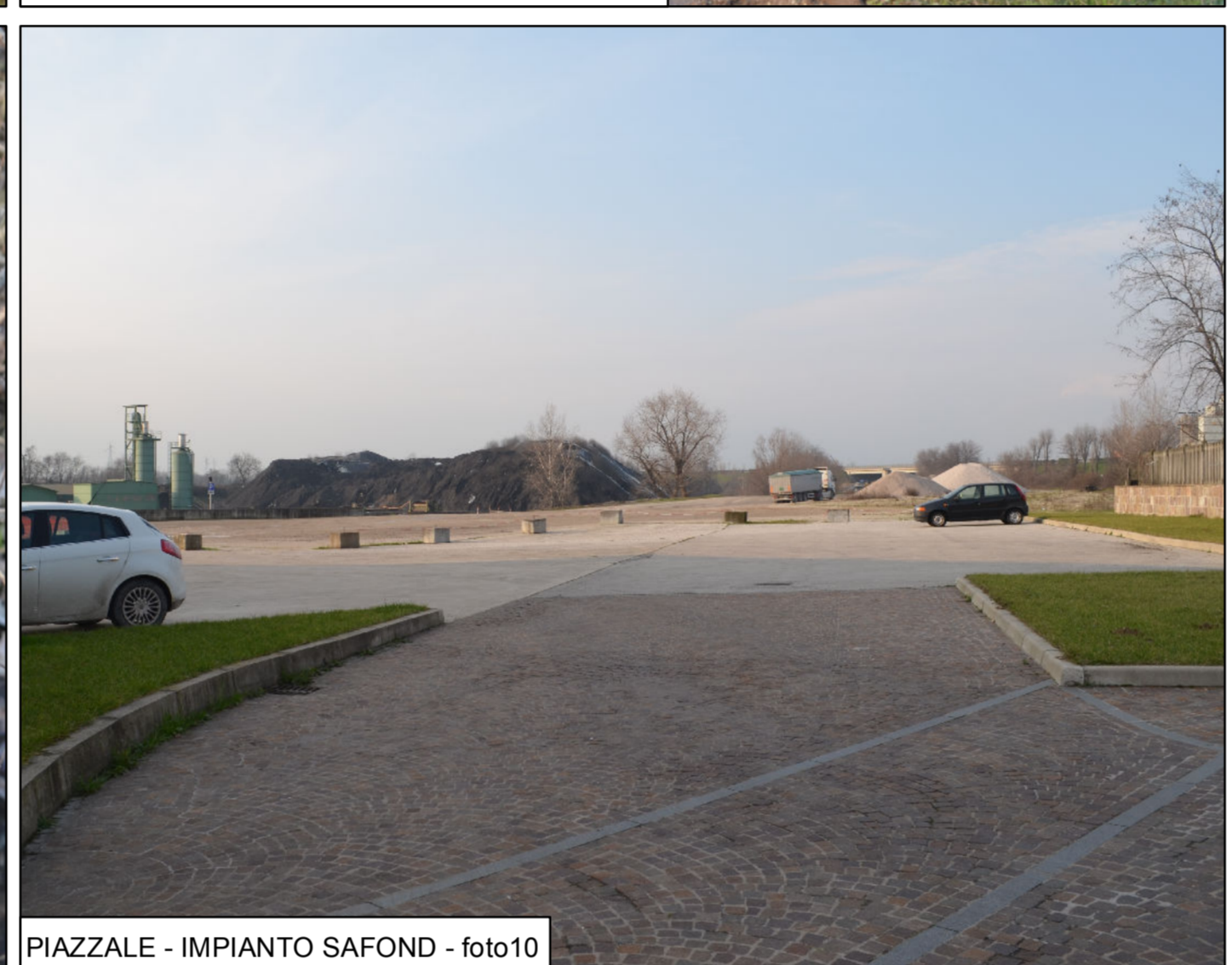
PIAZZALE - IMPIANTO SAFOND - foto 10