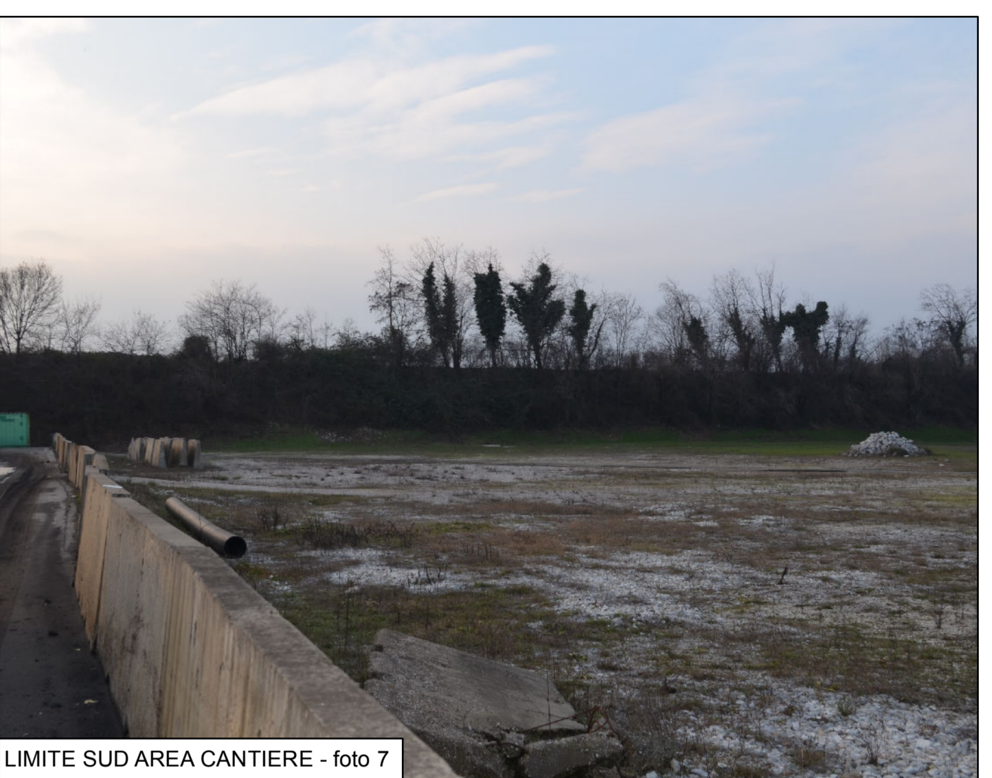
LIMITE SUD AREA CANTIERE - foto 7