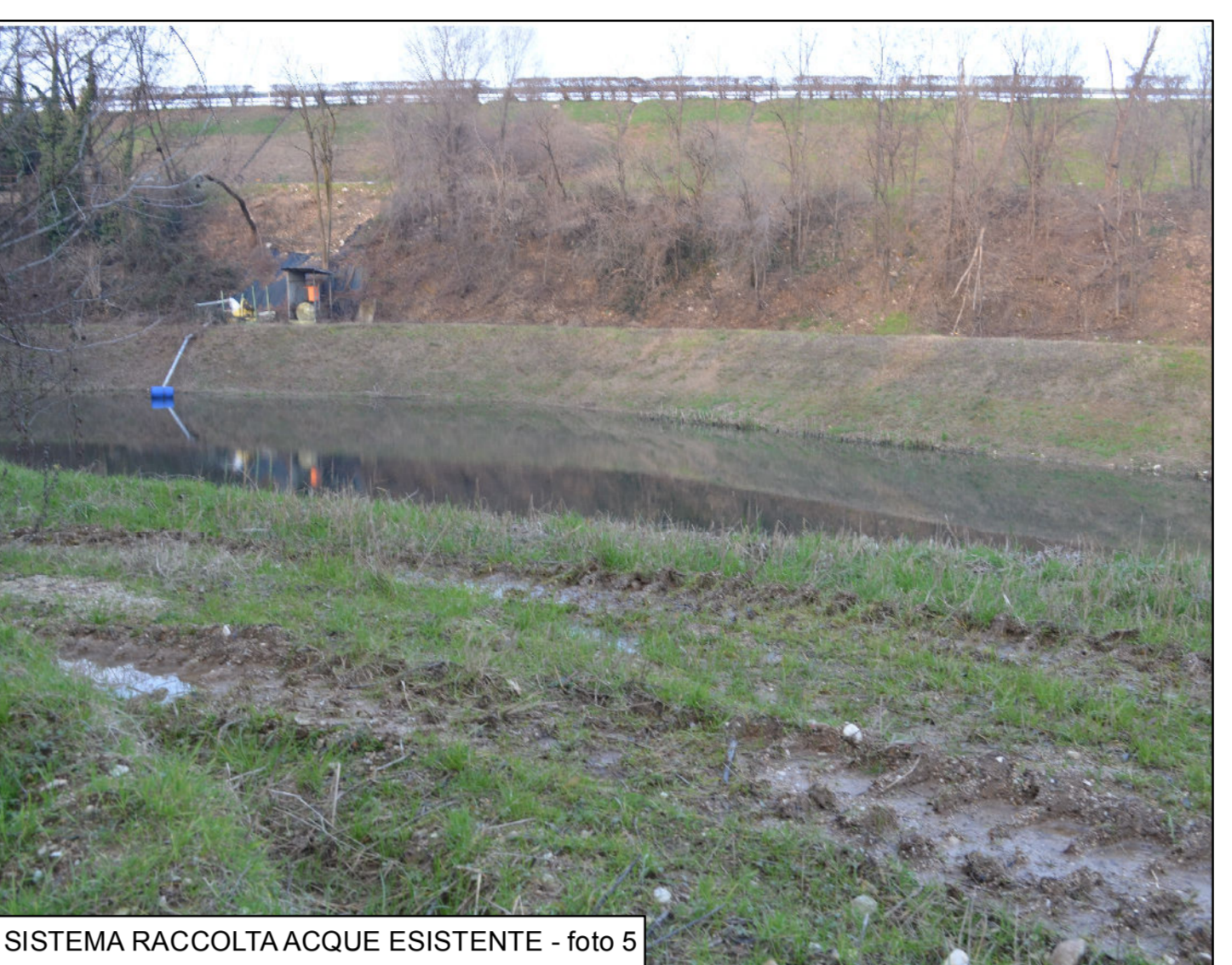
SISTEMA RACCOLTA ACQUE ESISTENTE - foto 5