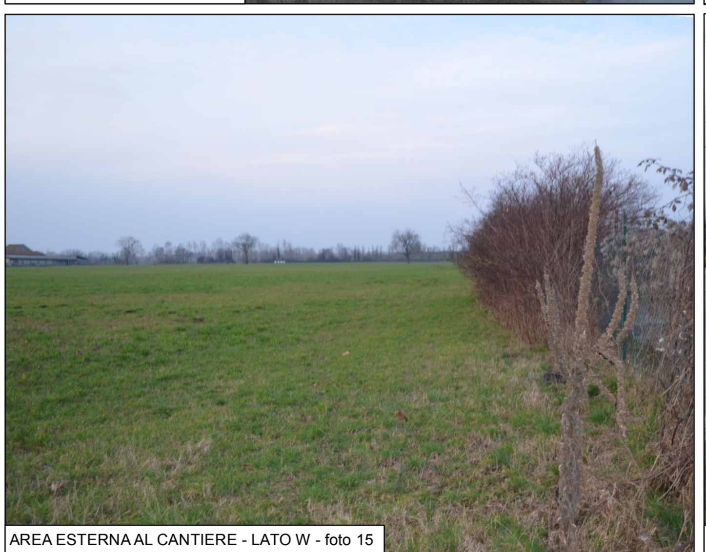
AREA ESTERNA AL CANTIERE - LATO W - foto 15