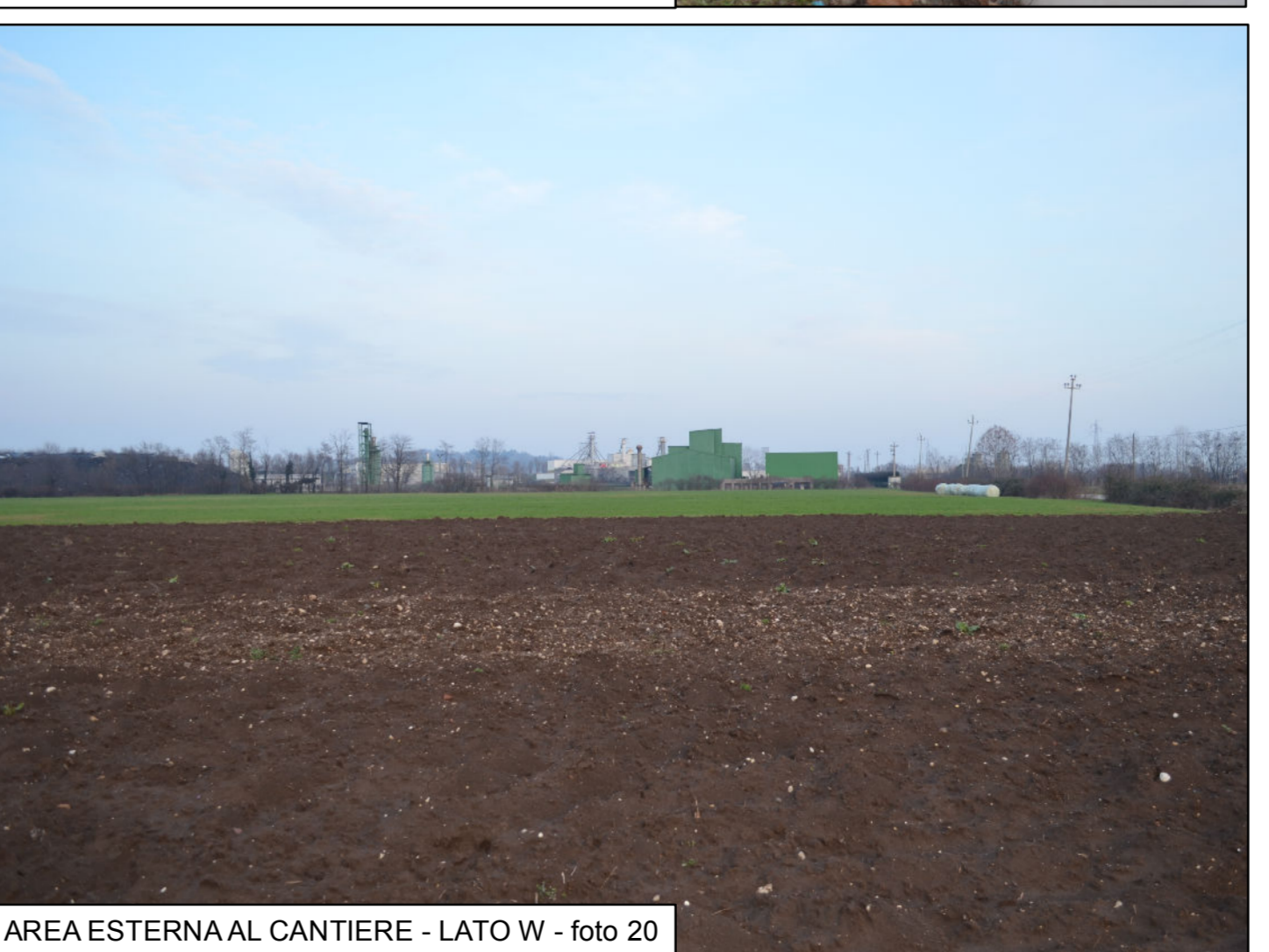
AREA ESTERNA AL CANTIERE - LATO W - foto 20