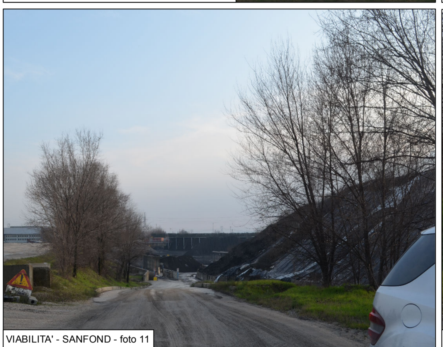
VIABILITA' - SAFOND - foto 11