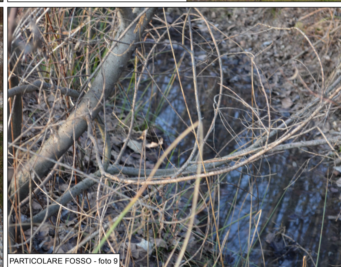
PARTICOLARE FOSSO - foto 9