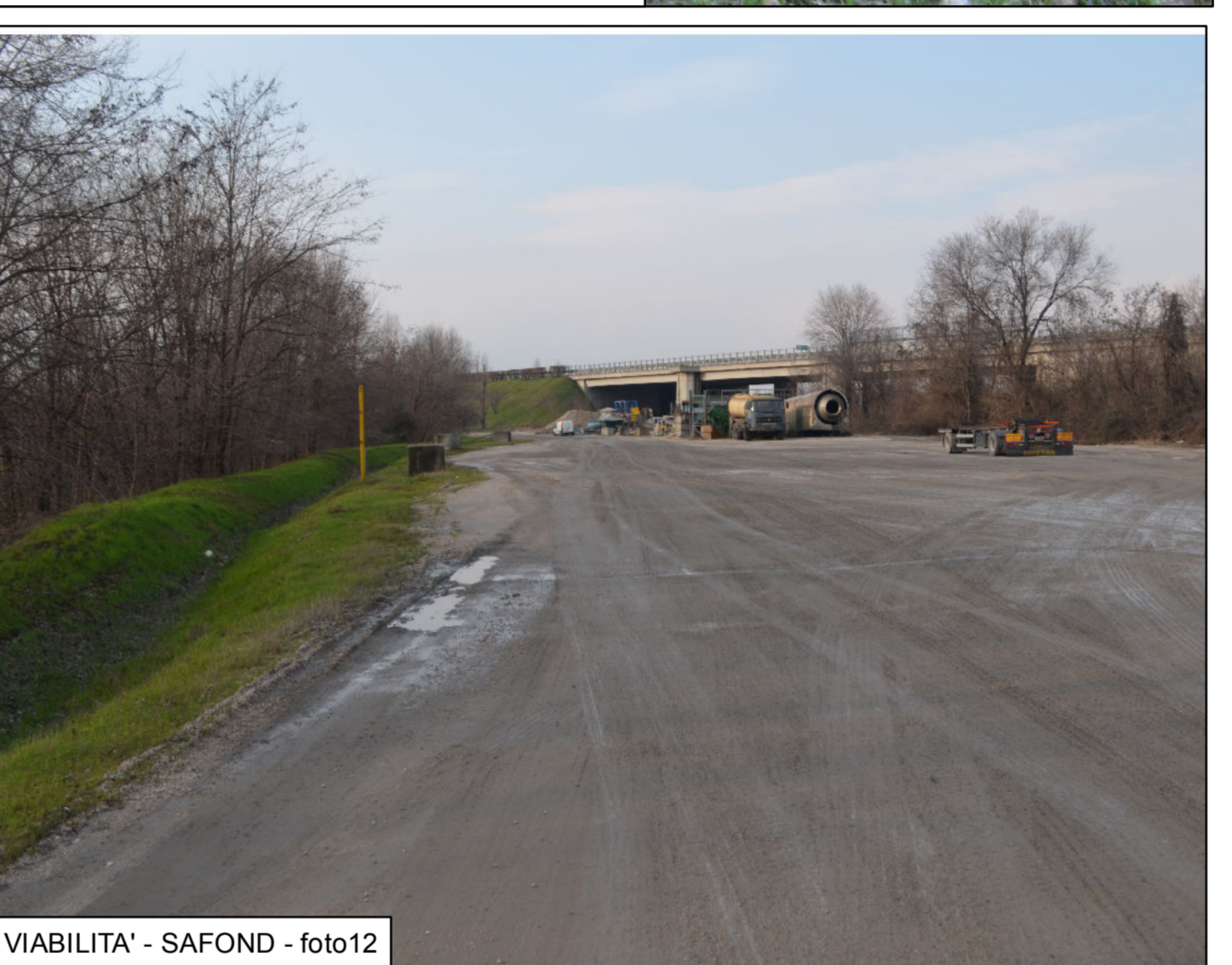
VIABILITA' - SAFOND - foto 12