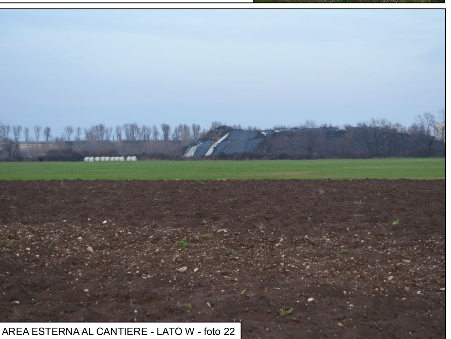
AREA ESTERNA AL CANTIERE - LATO W - foto 22