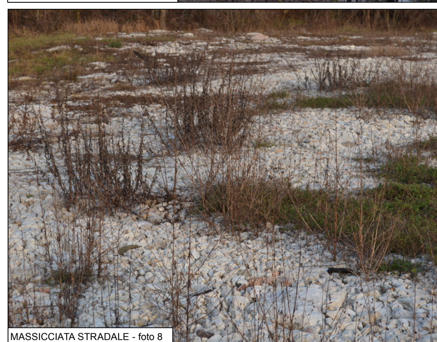
MASSICCIATA STRADALE - foto 8