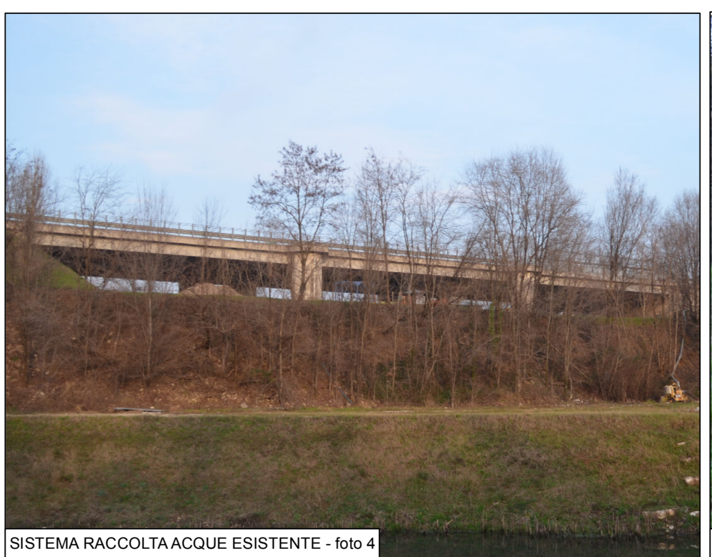
SISTEMA RACCOLTA ACQUE ESISTENTE - foto 4