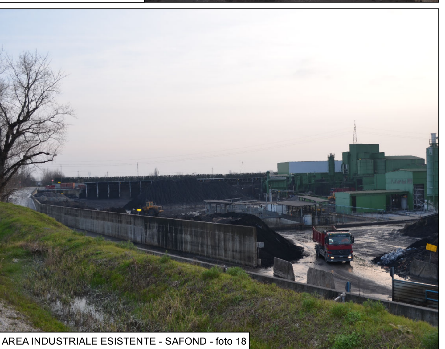
AREA INDUSTRIALE ESISTENTE - SAFOND - foto 18