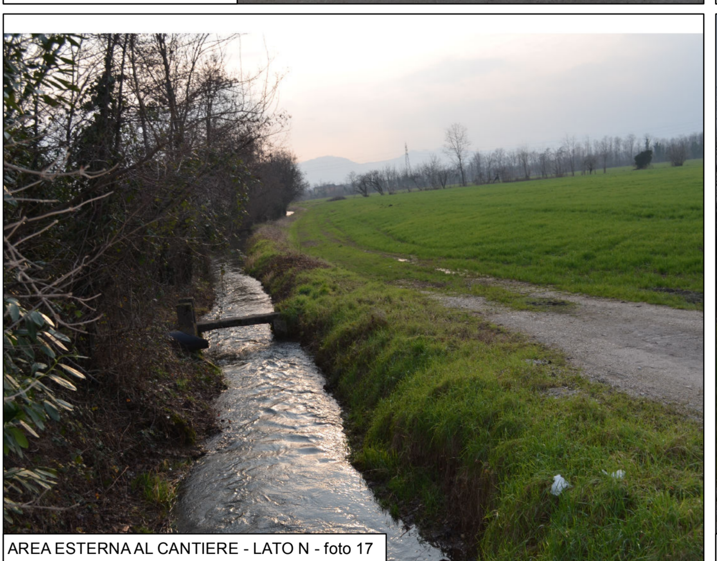
AREA ESTERNA AL CANTIERE - LATO N - foto 17