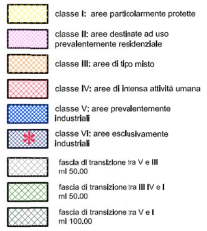
Zonizzazione acustica Comune di Montecchio Maggiore