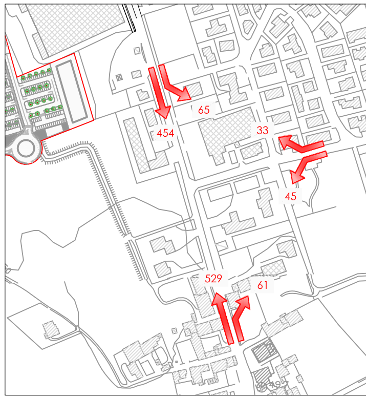
INTERSEZIONE 3 - FLUSSI FUTURI