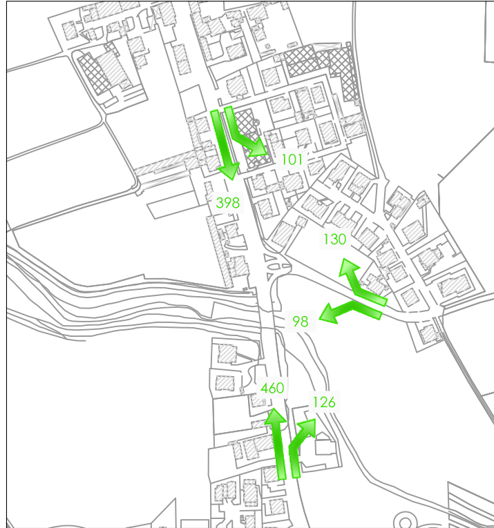
INTERSEZIONE 4 - FLUSSI FUTURI