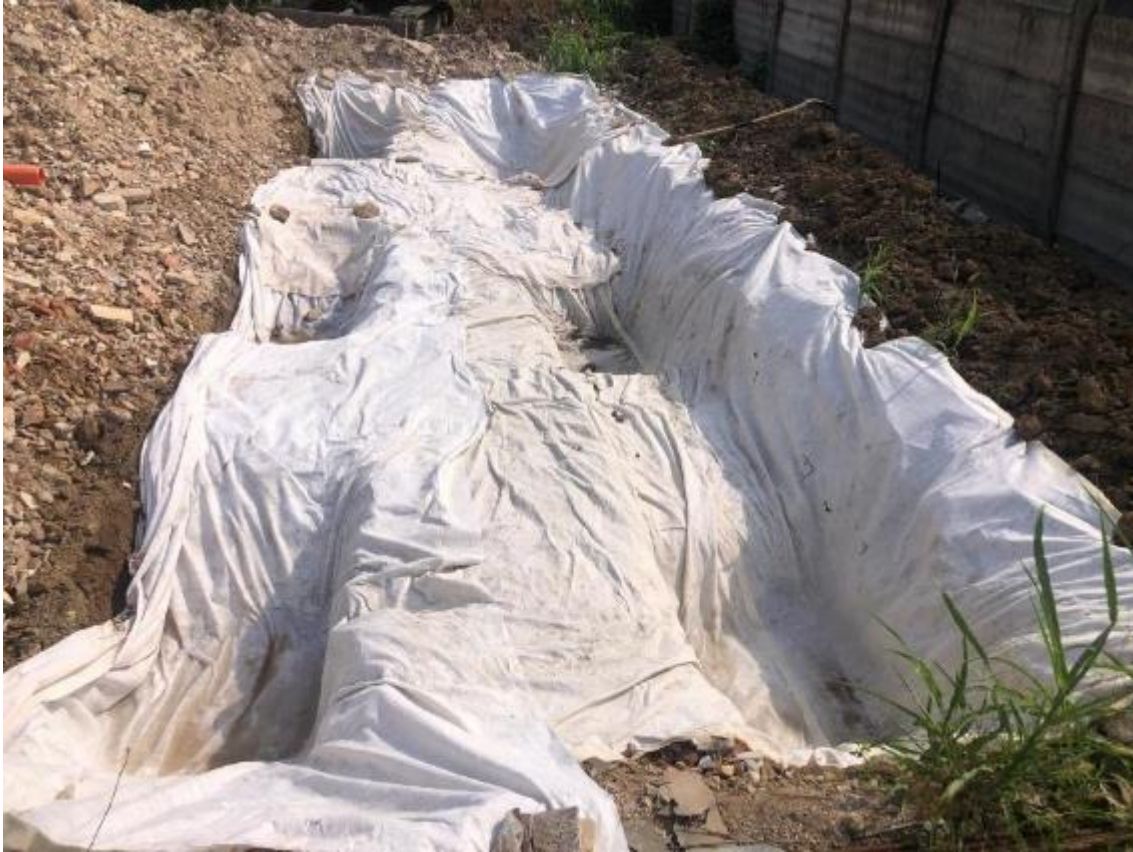
Foto 9. Sistema di dispersione in fase di realizzazione