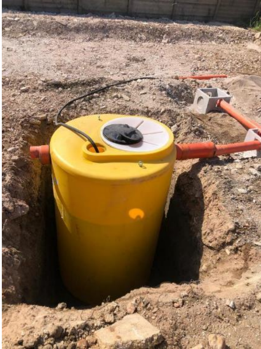
Foto 11. Sistema di sedimentazione/dissoluzione in fase di realizzazione