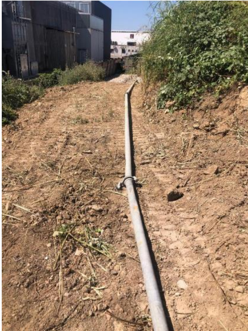
Foto 17. Tubazione di adduzione al sistema di trattamento