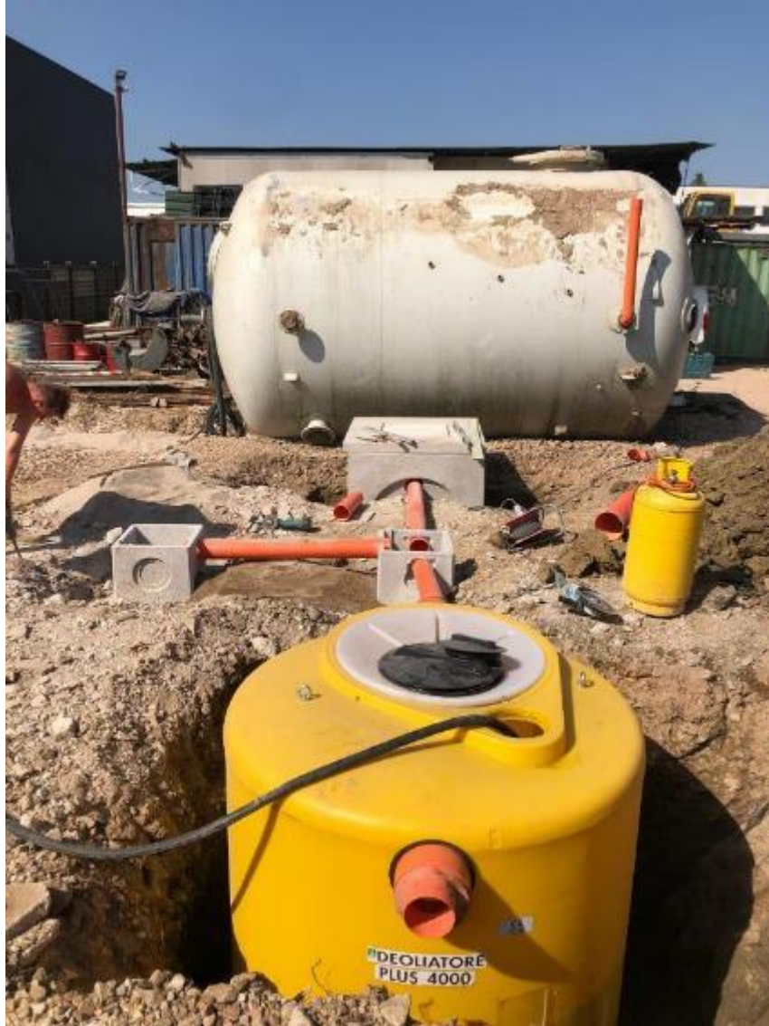
Foto 12. Sistema di trattamento in fase di realizzazione