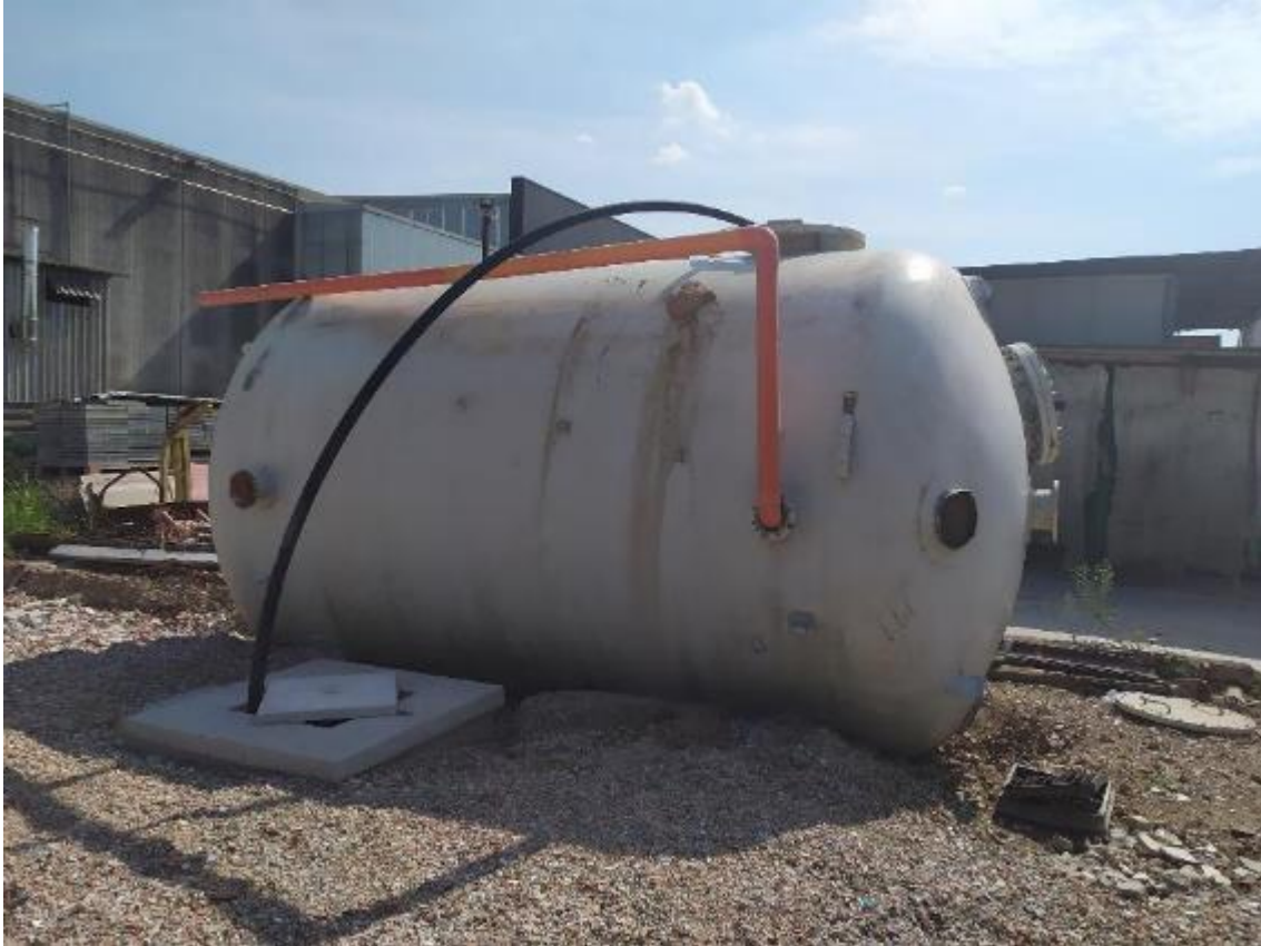
Foto 13. Cisterna per recupero acque bagnatura