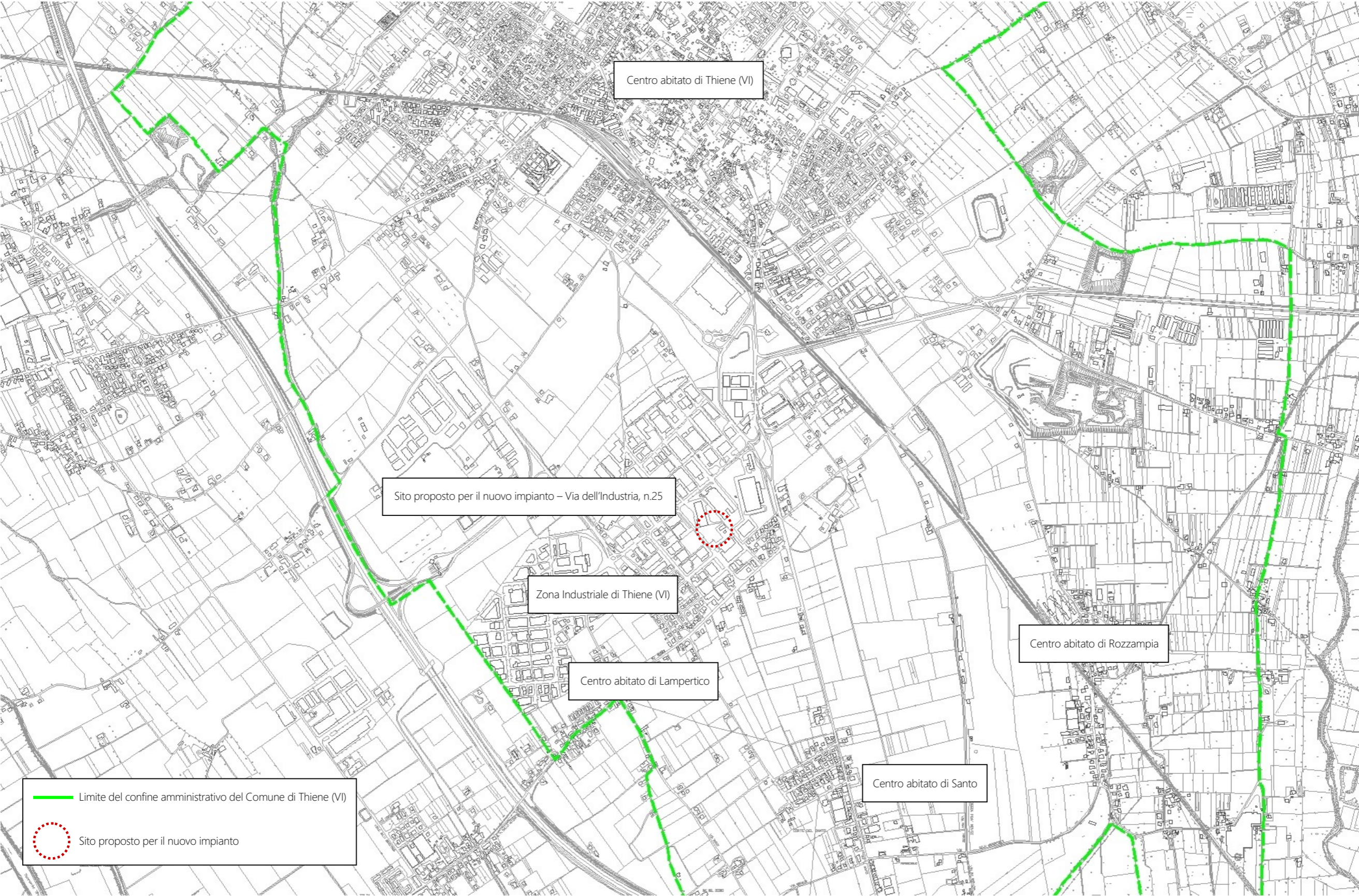
(elaborazione fuori scala su Carta Tecnica Regionale)