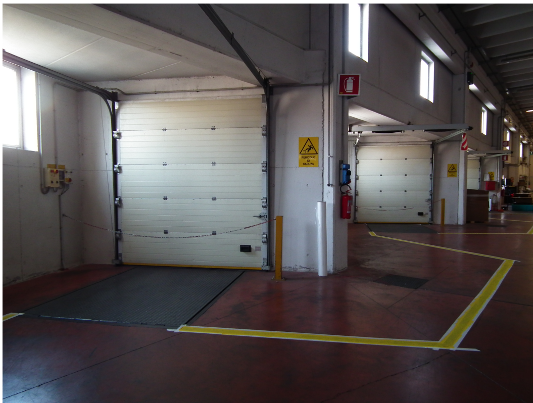
Fig.5 - Vista esterna della porzione di fabbricato industriale esistente - N.2 portoni rialzati di carico-scarico.