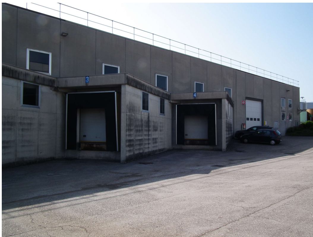
Fig.3 - Vista esterna della porzione di fabbricato industriale esistente - N.2 portoni rialzati di carico-scarico.