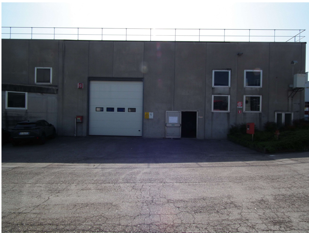
Fig.2 - Vista esterna della porzione di fabbricato industriale esistente - Portone principale di accesso.