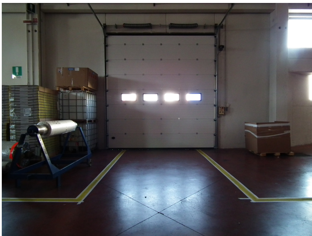
Fig.4 - Vista interna della porzione di fabbricato industriale esistente - Portone principale di accesso.