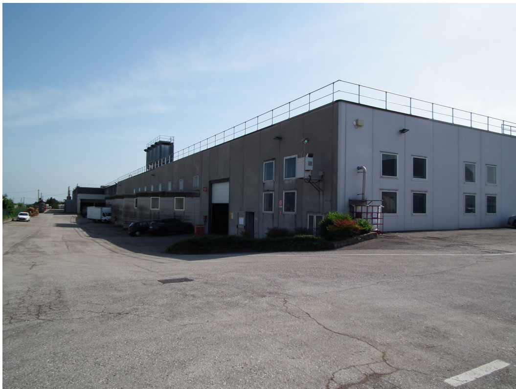
Fig.1 - Vista panoramica esterna della porzione di fabbricato industriale esistente.