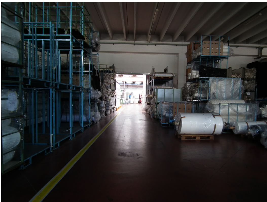
Fig.8 - Vista interna della porzione di fabbricato industriale esistente - Materiale tessile in stoccaggio e portone taglia fuoco.