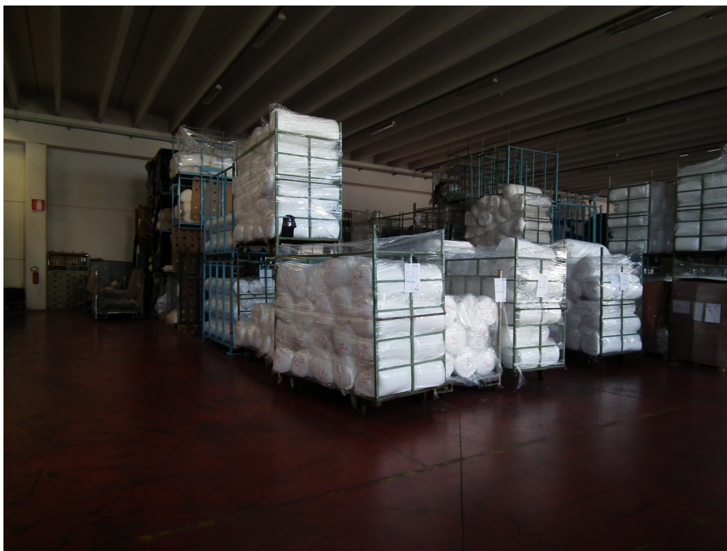
Fig.6 - Vista interna della porzione di fabbricato industriale esistente - Materiale tessile in stoccaggio.