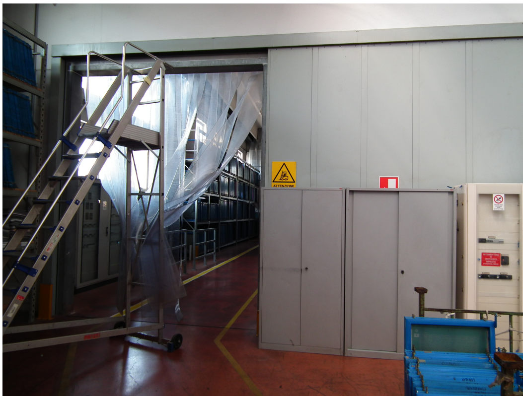
Fig.7 - Vista interna della porzione di fabbricato industriale esistente - Portone tagliafuoco verso l'area di stamperia.