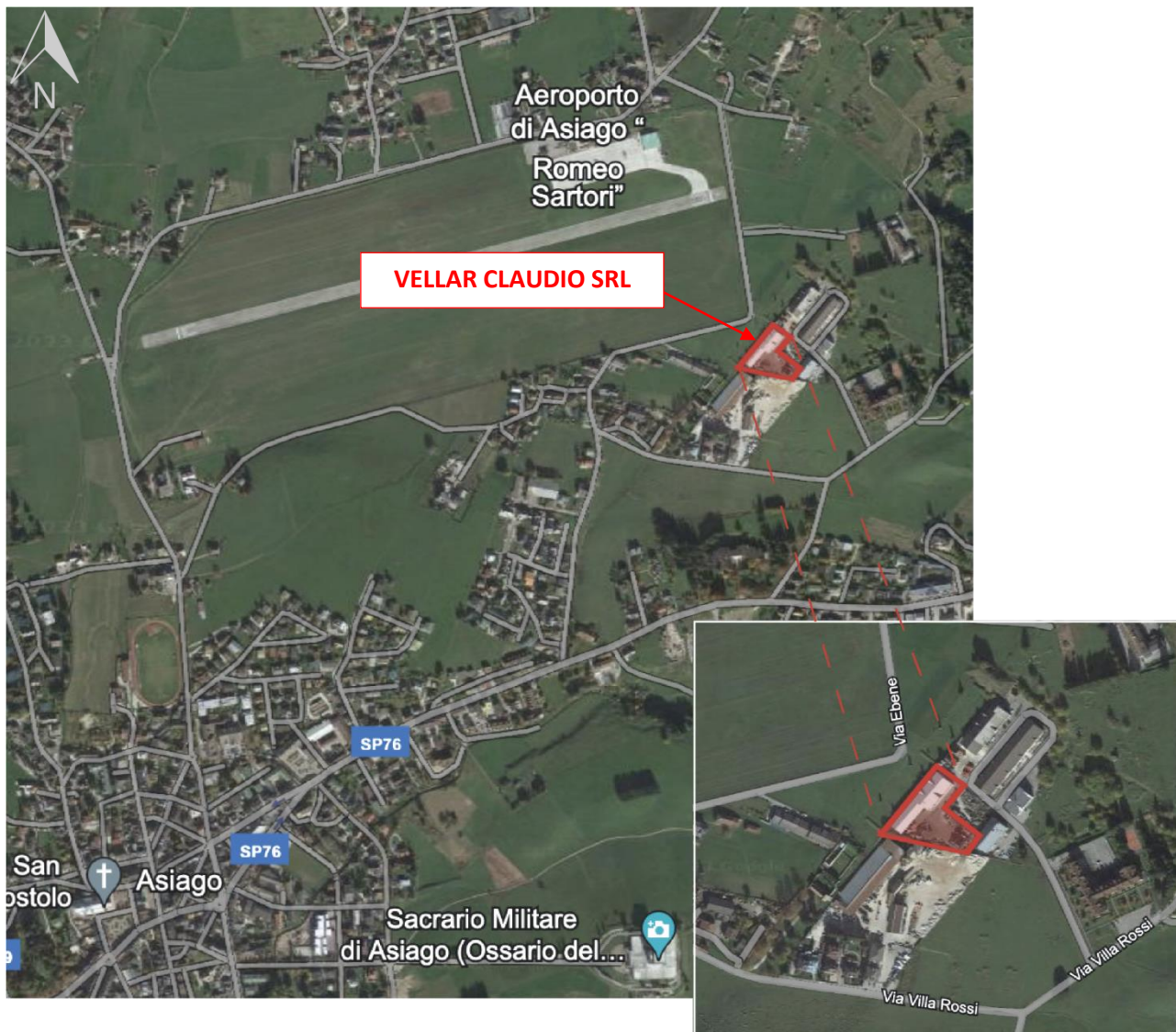
Figura 1 – Individuazione della posizione dell'impianto nel territorio della Provincia di Vicenza

L'impianto oggetto della presente istanza di modifica è sito nel Comune di Asiago in via Villa Rossi n.65.