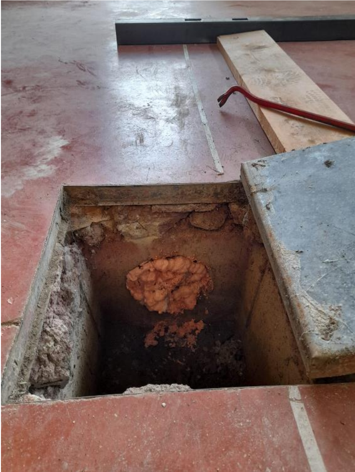
Foto 9 – Pozzetto di raccolta di eventuali spanti all'interno del capannone, idraulicamente isolato