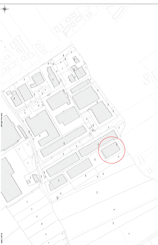
ESTRATTO CATASTALE - Foglio 9 - scala 1:2000