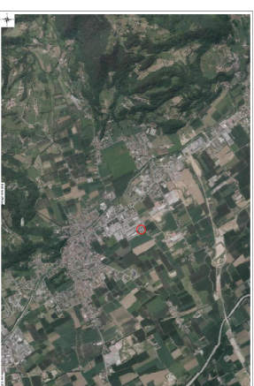
ORTOFOTO - scala 1:25000