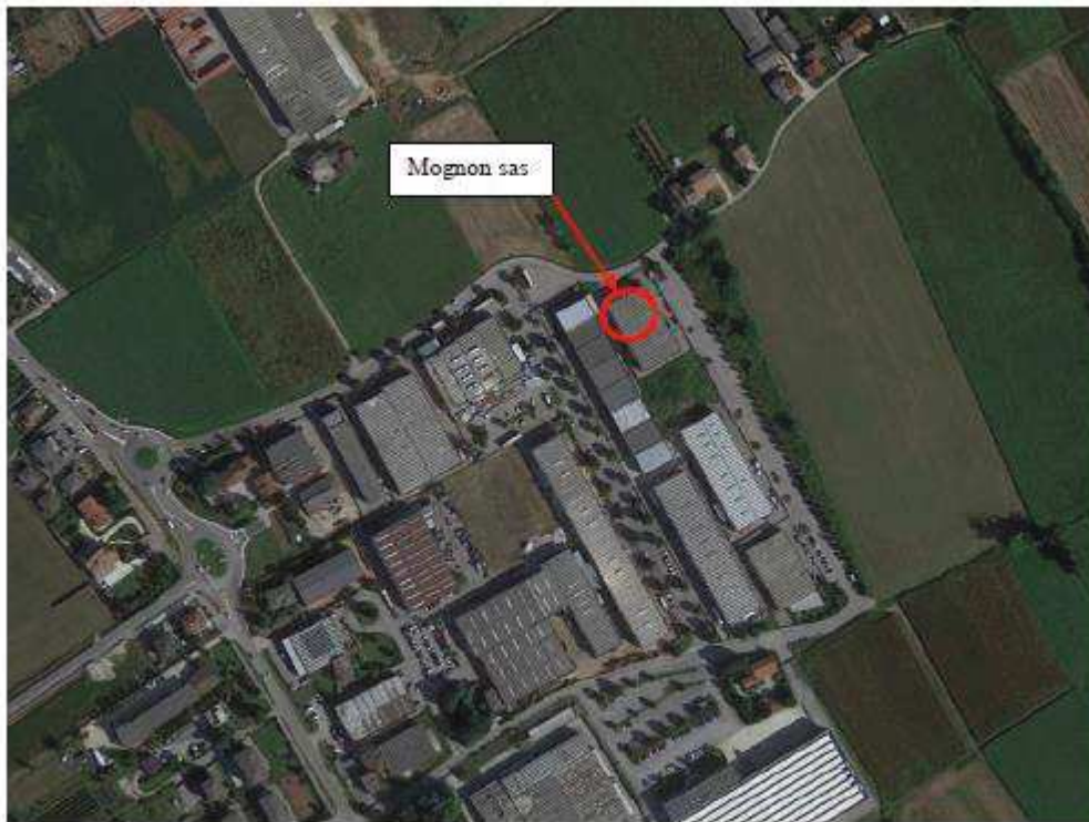
Figura 2. Veduta aerea della ditta Mognon sas. Fonte: Google Earth (data acquisizione immagine 09/05/2019, altitudine 1.12 km)